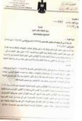
بغداد - الزمان

بغداد - ساري تحسين بممارسة مهام رئيس الوزراء، مضفا انه (ليس له لوحد حل البرلمان حتى لو اجتمعت سلطنا رئيس الوزراء مع سلطات رئيس الجمهورية، لعدم اجتماع هذه الصلاحيات في شخص رئيس الجمهورية لوحد، مع ملاحقة حالة استقالته فان هناك ناشئين له هما نادر الغضبان وزير النفط ووزراء حسين وزير المالية، فيما نائب رئيس الوزراء وقومان بمهمة رئيس الوزراء في حالة غيابه إلى سيب، بما فيها استقالة رئيس الوزراء كما هو مقرر عقلا ومقرر قانونيا) وفي سياق متصل أعلن عسما اول امين الائتلاف في رسالة موجهة إلى رئيس الجمهورية بزم صالح ورئيس البرلمان محمد الحليوسى واعترض المجلس عن اللجوء إلى (الغياب الطوعي)، ادعيا