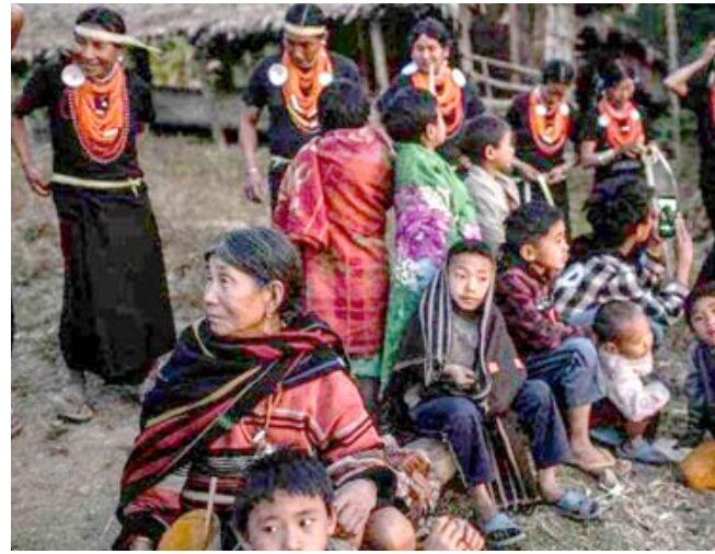
طقوس: شعب النانغا يؤدي طقوس الحصاد في جبال بورما

مع الهند في أقصى شمال البلاد، في تلك الليلة كانت النساء في قرية ساتيالو شونغ يرتدين الأسود ويضعن عقود اللؤلؤ حول أعناقهن وعصبية من أوراق النخيل على