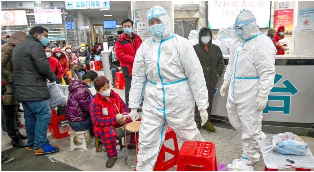
تفتيش؛ فريق طبي يجري جولة تفتيشية بحثاً عن مصابين بالكورونا

باليوم الثاني على التوالي إلى 346 امس السبت وفاة ثانية جراء فيروس كورونا المستجد وهي ثاني ضحية أوروبية في وقت يزداد القلق حيال ارتفاع عدد الإصابات خارج الصين فيما دعت منظمة الصحة العالمية إلى التحرك لإحتواء وباء اصاب 77 ألف شخص في العالم. والضحية الأوروبية الثانية هي امرأة إيطالية، كانت في المستشفى منذ حوالي عشرة أيام في لومبارديا (شمال) وفق ما أفادت وكالات الأنباء الإيطالية التي لم تُحدد عمر الضحية. وأعلن خلال الليل عن أول حالة وفاة في إيطاليا هو رجل يبلغ 78 عاماً. وأحصيت نحو ثلاثين إصابة حتى الآن على الأراضي الإيطالية بينهم أكثر من 25 في لومبارديا حيث تقرر عزل حوالي عشر مدن بشكل كامل منذ الجمعة، وأول شخص توفي في أوروبا بعد أن أصيب بالوباء الذي ظهر للمرة الأولى في كانون الأول/ديسمبر في مدينة ووهان في وسط الصين، هو سائح صيني من مقاطعة هوبي، وعاصمتها ووهان. وقد وصل هذا الرجل البالغ 80 عاماً في 23 كانون الثاني/يناير إلى باريس حيث توفي في 14 شباط. خارج الصين القارية (من دون هونغ كونغ وماكاو) سُجلت أكثر من 1300 إصابة حتى الآن خصوصاً في كوريا الجنوبية واليابان.