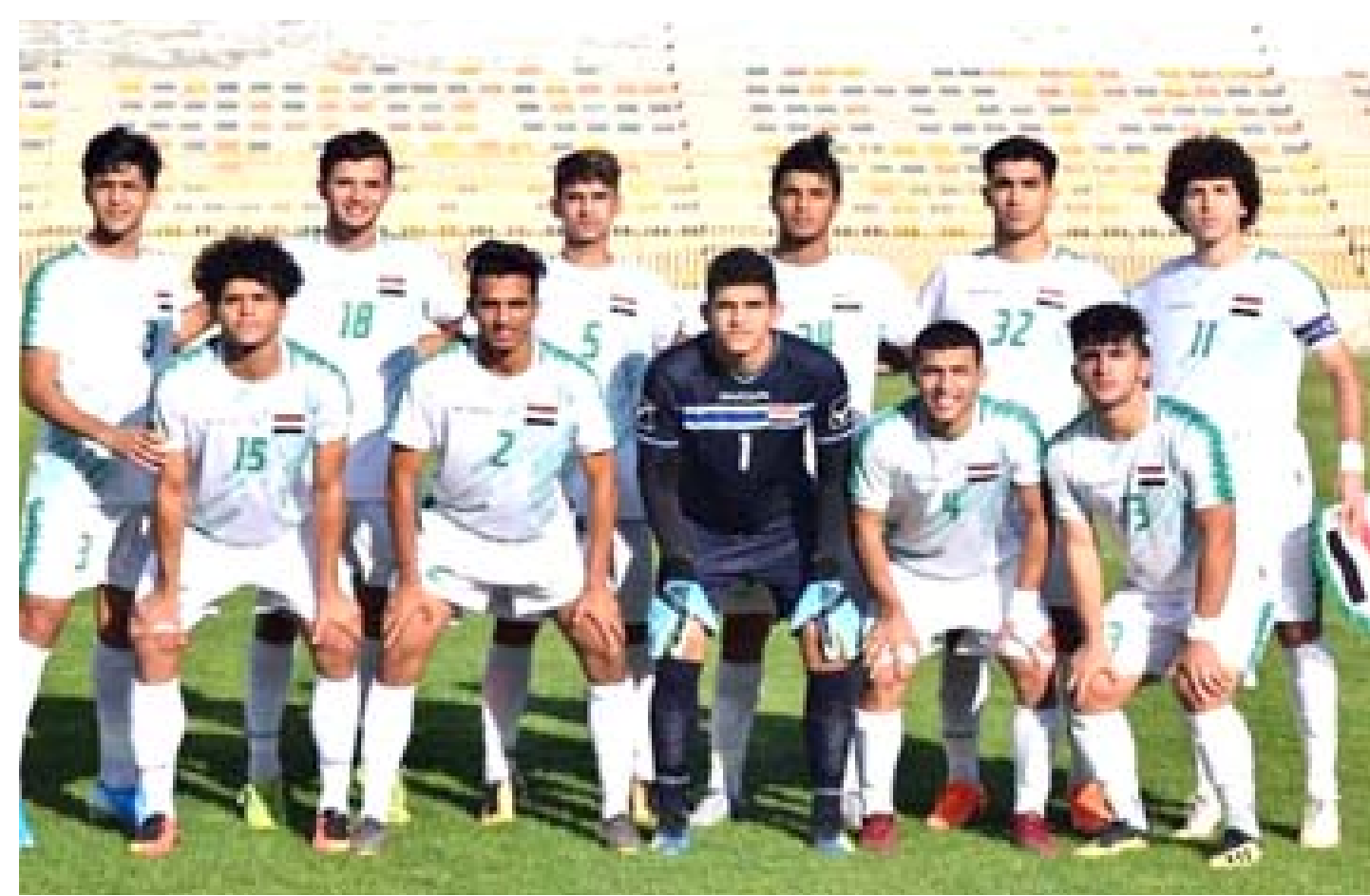
مواجهة : يخوض منتخب الشباب اليوم مواجهة قوية أمام أصحاب الأرض الكويت في بطولة العرب

الطلاب والنجم يعود الطلاب للمعب الشعب وتحت إشراف جمهوره في مواجهة النجم الأمل في محو آثار خسارة الغريم الزوراء بالهدف القاتل وسيكون اللاعبين امام حاجة لإظهار مهاراتهم وتقديم مستوى افضل والسيطرة على الأمور ولمصلحة الأندية والفرصة في مشاهدة النتيجة المطلوبة وليس الأداء حسب لان هذا غير مهم امام الخروج بفوائد المباراة التي تشكل التحدي بعد نكسة الغريم والآثار النفسية التي تركتها في نفوس الأناصر واللاعبين والمدرب بعدما انقلبت الأمور امام جمهوره الفريق الذي لايريد تكرار دون استثناء وان يستعيد اللاعبين دورهم عبر العودة لسكة الانتصارات وان يكون الفريق أكثر اهتمام في لقاءات الأرض امام دوري من مرحلة واحدة، بالمقابل يسعى النجم الظهور مهاجما ممكن ان تنعكس على مسار الاختيار الصعب وفي ان يلعب الفريق بالطريقة التي يتفادى فيها النتيجة السلبية الثانية لان غير ذلك ستضيق المساحة ويتسبب بتوسيع الفارق في سلم الترتيب مايجعل اللاعبين التركيز على مجمل المشاركة المتوقع سيكون الأخيرة بطل الدوري والذي يمر بحالة نفسية متازمة ومعنويات مزاجية التي عليها اللاعبين بعد خسارة الاثنى امام الوحدة وخيبة الأمل في تصفيات المجموعة بالبطولة الآسيوية المحيط تماما لكن يؤكد لإيريدان يتهاون محليا والدخول بقوة في أول اختبار غير سهل اطلاقا فداعا عن اللقب المحلي عبر خطوط مدججة بالاسماء التي ينتظر منها ان تعكس نفسها بشكل افضل في منافسات الداخ بعد الخروج المر من بطولة الملك والتراجع بدوري أبطال آسيا ولم يبق الا التحكم في منافسات