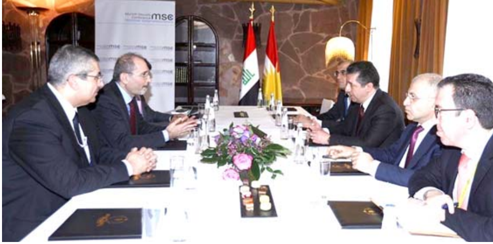
اجتماع: مسرور البارزاني يجتمع مع وزير الخارجية الاردني