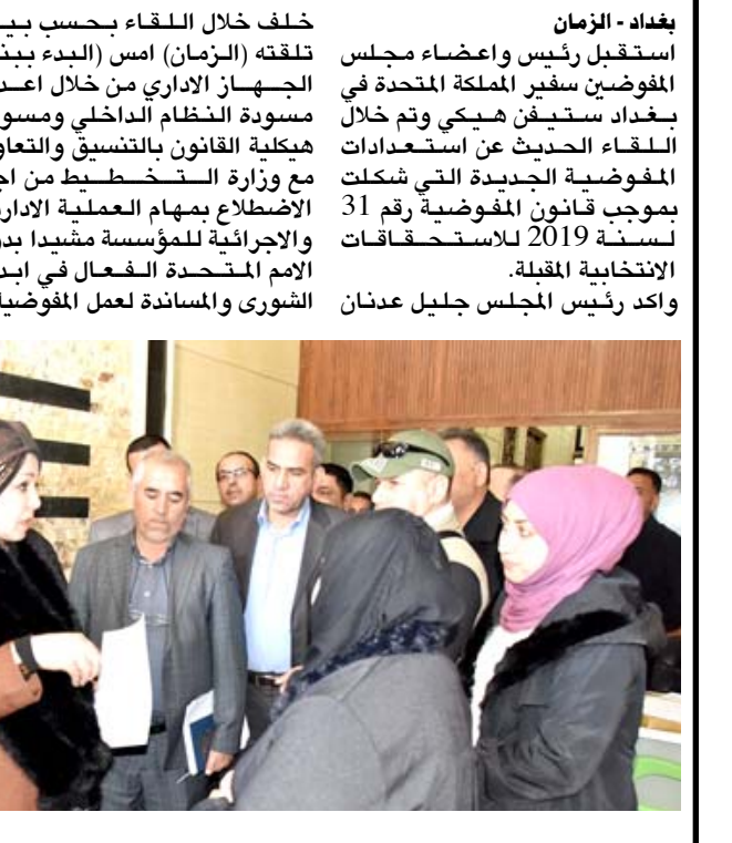
لقاء: السفير البريطاني الذي أكد

خلف خلال اللقاء بحسب بيان تلقته (الزمان) امس (البدء ببناء الجهاز الاداري من خلال اعداد مسودة النظام الداخلي ومسودة هيكلية القانون بالتنسيق والتعاون مع وزارة التخطيط من اجل الاضطلاع بمهام العملية الادارية والاجرائية للمؤسسة مشيداً بدور الامم المتحدة الفعال في اداء الشورى والمساندة لعمل المفوضية).