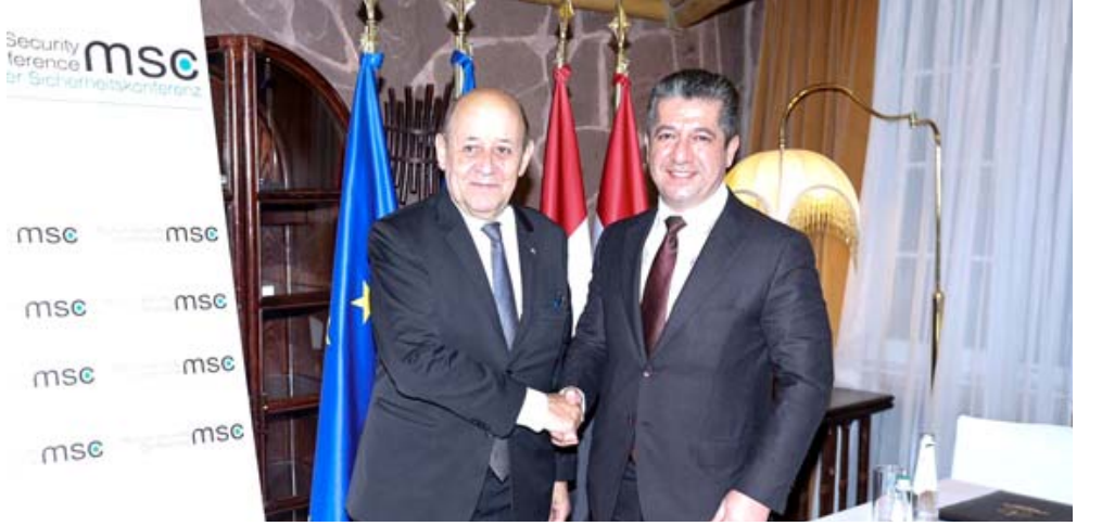
مصافحة: مسرور البارزاني ومصافغ وزير الخارجية الفرنسي