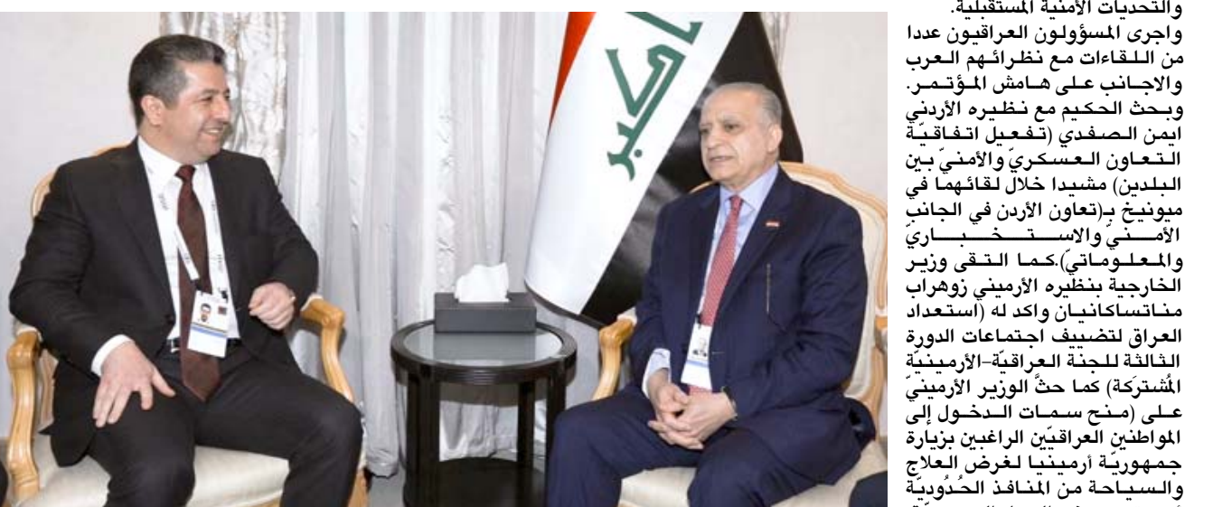
لقاء: وزير الخارجية محمد علي الحكيم خلال لقائه مسرور البارزاني

بالبقول(نحن مع تشكيل حكومة تحظى بدعم أغلب مكونات العراق وتلتزم بالحقوق الدستورية لإقليم كردستان). وفي محور آخر من الاجتماع، جرى النقاش بشأن أهمية استمرار وتطوير التنسيق بين الجيش العراقي وليبيرشمره من أجل مواجهة التهديدات المتواصلة لإرهابيي داعش). وعقد البارزاني أيضاً اجتماعاً مع الأمين العام للجامعة العربية، أحمد أبو الغيط، بالإضافة إلى اجتماع آخر مع وزير الخارجية الروسي سيرجي لافروف. وقال البارزاني، في تغريدة على تويتر، عقب اجتماعه مع لافروف (أبركنا في اجتماعنا مع لافروف الحاجة إلى تخفيف حدة التوتر، لا سيما في سوريا، وكمرت طلبي بان تساعد روسيا في التوسط من أجل التوصل إلى تسوية سياسية طويلة الأجل في سوريا تحترم حقوق الدعم الأمريكي عن طريق المتفاوضون لقوات البيشمركة، والتنسيق بشكل أوسع لمنع عودة داعش، وتوضيح موقف الإقليم بشأن النزاع الإقليمي في المنطقة، بطريقة تمنع زج الإقليم في نزاعات القوى الكبرى في المنطقة).