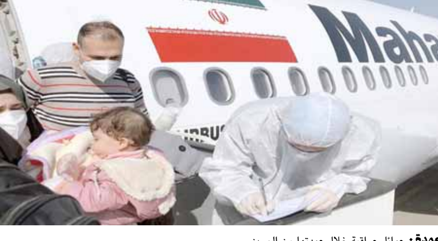
عودة: عوائل عراقية خلال عودتها من الصين

فيما دعت مفوضية حقوق الإنسان الحكومية إلى إعادة ما تبقى من الطلبة العراقيين في الصين، في وقت نفت وزارة التربية تسجيل اي اصابة بالفايروس، وشهد الطاران نصب جهاز الكشف الحراري عن حالات الإصابة بالفايروس لغرض فرض الإجراءات الوقائية للمسافرين القادمين إلى البلاد. وعلق مساعد وزير الصحة الإيراني علي رضا رئيسي على نقل طلاب عراقيين عبر الطائرة الإيرانية إلى بغداد، وقال رئيسي في تصريح امس ان (65 طالباً جامعياً عراقياً و24 سوريا ولبنانياً وأحدًا كانوا على متن الطائرة الإيرانية العائدة إلى العراق)، لافتاً إلى (إعادة الطلبة