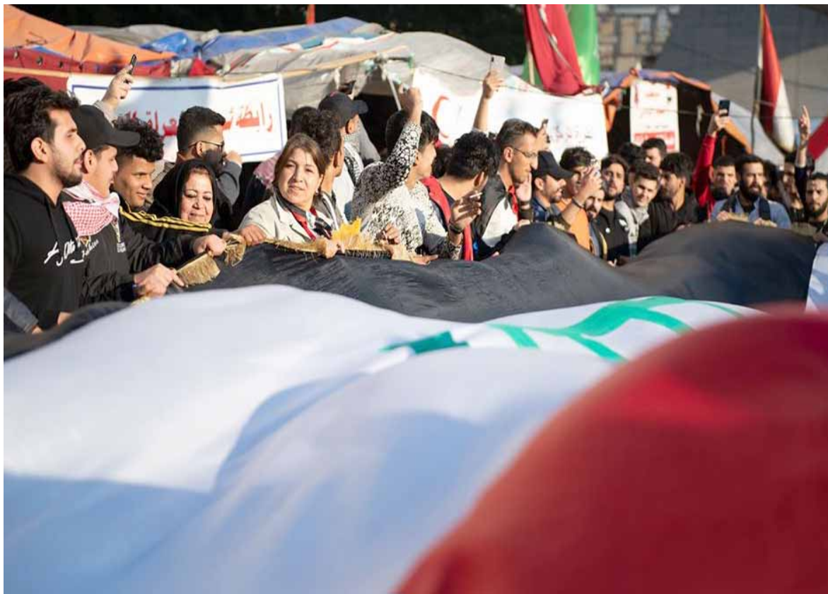
احتجاجات: تواصل الاحتجاجات اليومية في ساحة التحرير المستمرة منذ أشهر