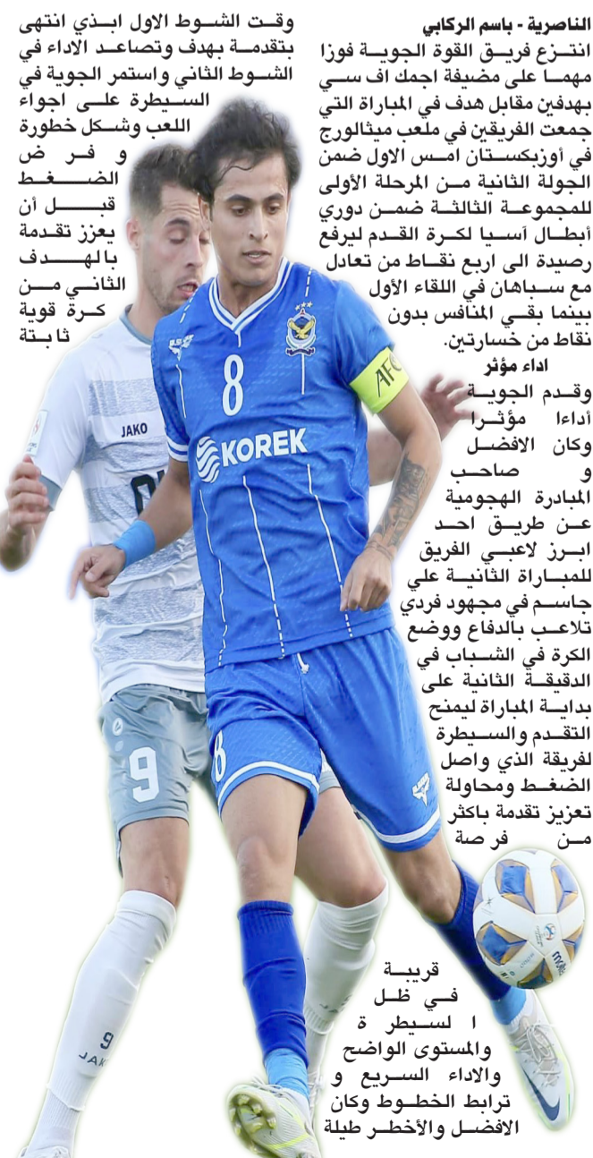
قريبة في ظل المستوى الواضح والاداء السريع و ترايط الخطوط وكان الأفضل والأخطر طيلة