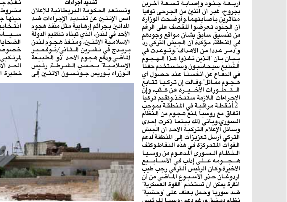
مراقبة: نظرة مراقبة للجيش التركي في معبر حطاطي في ادلب

انقرة - (ا ف ب) - قتل خمسة جنود أتراك ومدني يعمل مع الجيش ايس الاثنين في قصف مدفعي للنظام السوري في منطقة ادلب بشمال غرب سوريا، وفق ما اعتت وزارة الدفاع التركية. وكانت الوزارة اذات في وقت سابق عن مقتل أربعة جنود واصابة تسعة آخرين بجروح، غير ان اثنين من الجرحى توفيا متأثرين باصابتهم. وأوضحته الوزارة ان الجنود تعرضوا للصفص على الرغم من تنسيق سابق بشأن مواقع وجودهم في المنطقة، مؤكداً ان الجيش التركي رد ودمر عددا من الأعداف. وتوعدت في بيان بان الذين نفذوا هذا الهجوم الشنيع سيحاسبون وستستخدم حقنا في الدفاع عن أنفسهم عند حصول هجوم مماثل. وقالت ان تركيا اتصت بالخطوات الأخيرة عن كذب، وأن الإجراءات اللازمة ستتخذ. وتقيم تركيا 2 أنقطة مراقبة في المنطقة بموجب اتفاق مع روسيا لمنع هجوم من النظام السوري. ويأتي ذلك بينما ذكرت إحدى وسائل الإعلام التركية الأحد ان الجيش التركي أرسل تعزيزات إلى المنطقة لدعم القوات المتمركزة في هذه النقاط. وكف النظام السوري المدعوم من روسيا هجومه على ادلب في الأسابيع الأخيرة. وكان الرئيس التركي رجب طيب اردوغان حذر الاسوع الماضي من أن انقرة يمكن ان تستخدم القوة العسكرية ضد سوريا. وجمل بنصف على وحشية نظام دمشق، ورغم دعم روسيا للرئيس بشار الأسد. ودعم تركيا لفصائل مسلحة،