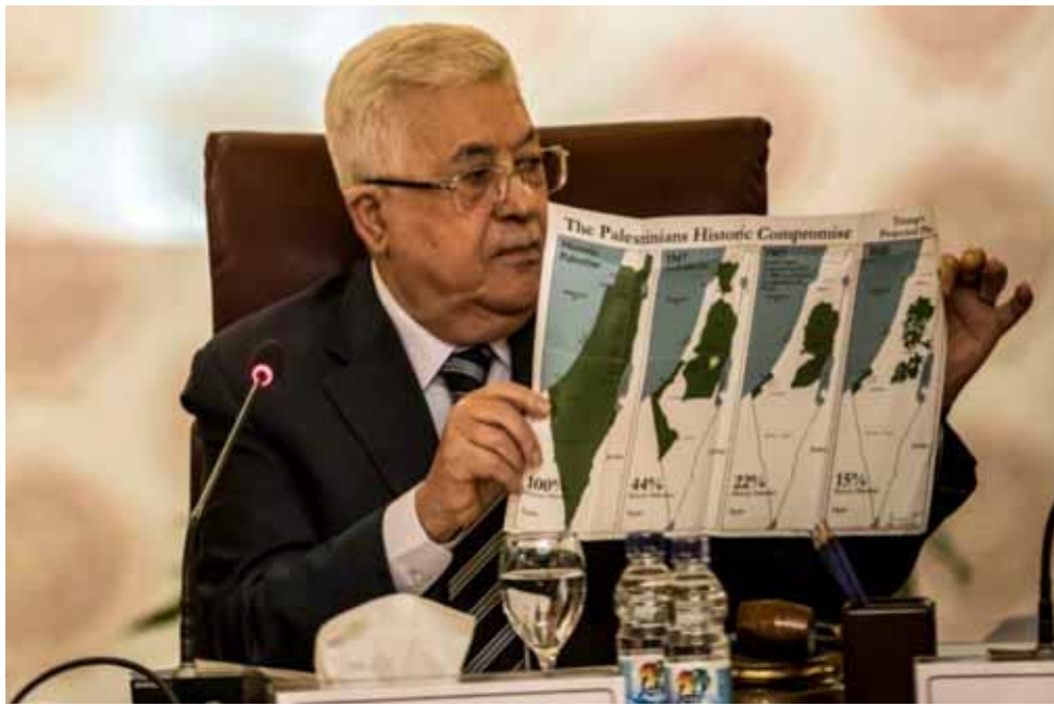
خارطة: الرئيس الفلسطيني محمود عباس يعرض مطوية تظهر خارائط فلسطين التاريخية منذ قرار التقسيم عام 1947

رام السله - (ا ف ب) : أكد الرئيس الفلسطيني محمود عباس الاثنين مواصلة السلطة الفلسطينية لعملها وقطع العلاقات الامنية مع الإدارة الأمريكية وإسرائيل في حال