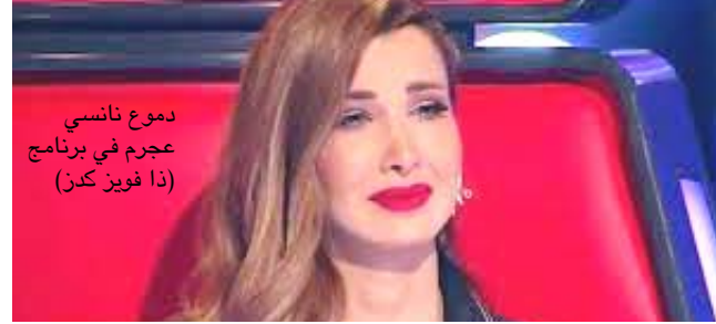
دموع نانسي عجرم في برنامج (ذا فويس كرز)

بيروت -الزمان شهدت احداث حلقات برنامج (ذا فويس كرز) التي بنت السبت الماضي موقفا مؤثرا بين احد الاطفال المشاركين وشقيقه، إذ ان الأخير فاجأ بوجوده في الحلقة، وذلك بعد غياب لـ 13سنوات عنه، وبدأت الحلقات المؤثرة مع غناء المتسابق العراقي عبد الكريم حاتم السعدي؛ اغنية لشقيقه المسافر وهداها له، من دون ان يستدير اي من النجوم المرشحين لاختياره. وقبل خروج المتسابق، طلب فريق البرنامج منه إعادة تصوير مشهد دخوله بحجة الأسباب التقنية، ليجد عند دخوله مجدداً ان كرسى نانسي عجرم يلف