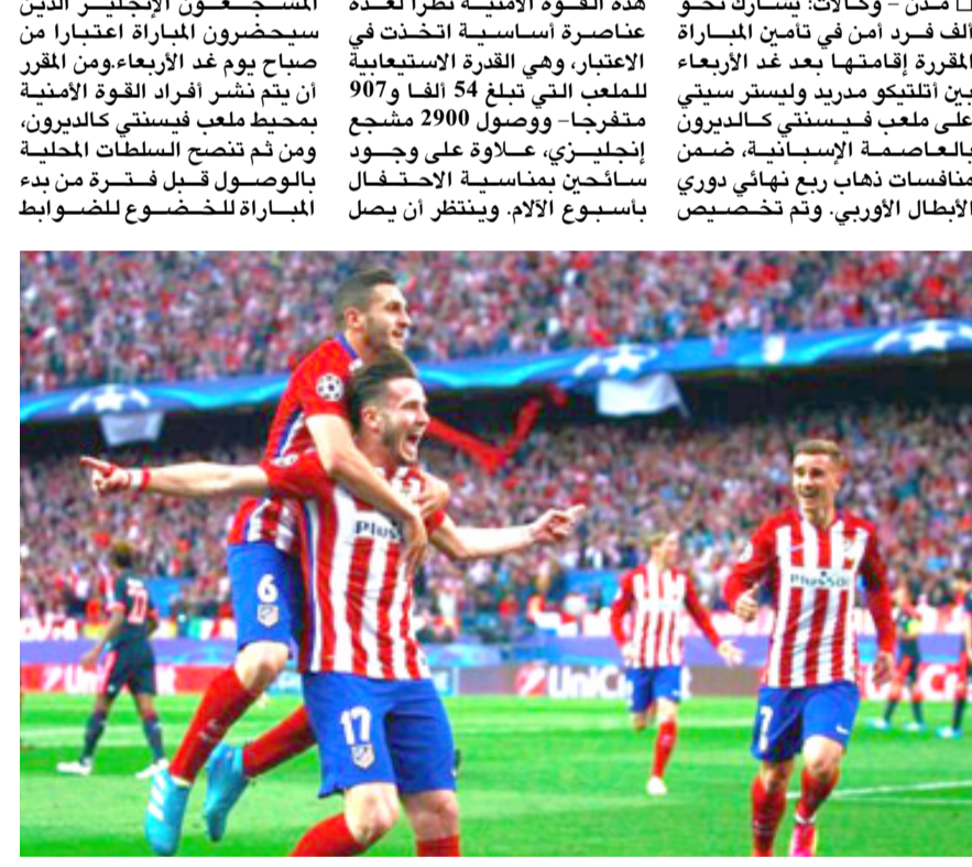
جانب من فرقة فريق أتلتيكو مدريد لحظة تسجيل الهدف

هذه القوة الأمنية نظرا لعدة عناصره الأساسية اتخذت في الاعتبار، وهي القدرة الاستيعابية للتلعب التي تبلغ 54 ألفا و 907 متفرجا - ووصول 2900 مشجع إنجليزي - عملا على وجود سائحين بمناسبة الاحتفال بأسبوع الالام. وينتظر ان يصل المشجعون الإنجليزي الذين سيحضرون المباراة اعتبارا من صباح يوم غد الأربعاء، ومن المقرر ان يتم نشر افراد القوة الأمنية بحيط ملعب فيسنتي كالدرون، ومن ثم تنصح السلطات المحلية ونسبه الختاني هيرنانديز تشافي، نجم برشلونة السابق والسند القطري الحالي، وأندريس انيسيتا، قائد البارسا، وقال توريه، في تصريحات نقلها موقع فور فور، لقد لعبت بجانب لاعبين مثل تشافي وأنيسيتا في برشلونة، وسيلفا في نفس نوعية هؤلاء اللاعبين، وأضاف لقد كان من اجل وصوله لـ 300 مباراة خاضها مع الفريق. نحن نقدره هنا، وجميعنا سعداء باللاعب معه، هو لاعب لديه ثقة كاملة في نفسه وقدراته، وله خبرة كبيرة. واتم توريه نحن نعترف البريميرليج جيدا، ونحن نلعب نكون في حاجة للاعب من نفس هذا النوع، والسيطرة على المباريات ويكون تكتيا. ويحصل مانشستر سيتي المركز الرابع بجدول ترتيب البريميرليج برصيد 61 نقطة، ويفارق 14 نقطة عن المتصدر تشيلسي.