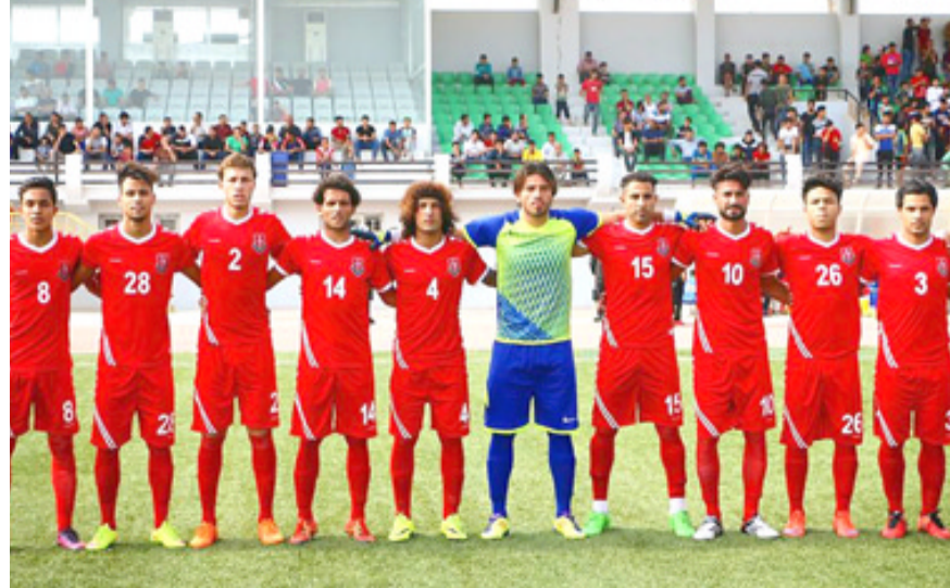
فريق الديوانية يتصدر مجموعته لدوري الدرجة الأولى