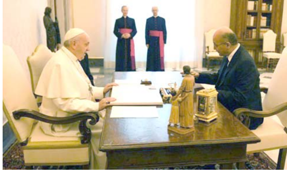
لقاء: جانب من لقاء البابا فرنسيس بالبرئيس برهم صالح في الفاتيكان

سئلت عن أي زيارات ملكية في المستقبل (لا توجد خطط لقيام أمير ويلز بزيارة رسمية لإيران). وتأتي رغبة الأمير تشارلز في زيارة إيران في وقت يشهد توترا متزايدا بين طهران والغرب. وقال الأمير تشارلز لصحيفة إنه يسعى لأن يكون صانع سلام وإنه يصلي من أجل السلام في الشرق الأوسط. وأضاف خلال المقابلة (اعتقد أن الأمر الأهم هو سلام عادل ودايم). في تكرار لتصريح أدلى به يوم الجمعة.