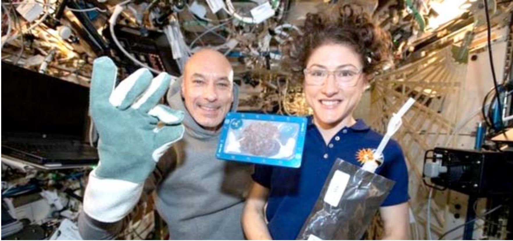
نموذج من الكعك الفضائي

الأوروبية، يراقب سير العملية ونشرت رائدة الفضاء كوتش تخريفة على موقع التواصل الاجتماعي (تويتر) أرسلتها من الفضاء قالت فيها ( لقد خبزنا الكعك وحضرنا الحلبي لبايا نويل هذه السنة. أعيداً سعيدة للجميع من محطة الفضاء) وخبز الكعك في فرن خاص صمم خصيصاً للعمل في مركز الفضاء ونقل الفرن ومستلزمات صنع الكعك على متن مركبة خاصة غادرت ولاية فرجينيا في نوفمبر/تشرين الثاني الماضي. وتصف الشركة التي صممت الفرن شكله بأنه ( عبة أسطوانية الشكل ومزولة، صممت خصيصاً لتكون صالحة للخبز بداخلها في ظروف الجاذبية في مركز الفضاء). ويجري تسخين المواد الغذائية في الفرن من خلال عناصر تسخين كهربائية تشبه تلك المستخدمة في جهاز تجميد الخبز، كما قالت الشركة وقالت ميري ميرفي، من مؤسسة الشحن (ناتو روكس) إنه (بينما نملك تقارير عن الرائحة والشكل من الرواد في محطة الفضاء، نحن متشوقون لفحص نتائج عملية الخبز). وذكرت شركة (نويل تري) أنها تخطط لعرض الخبزات لبشاهديها جمهور الزوار ويكتسبوا معلومات عن التجربة. وستساعد النتائج الخبراء في جهودهم المستقبلية لجعل الرحلات الفضائية طويلة الأمد أكثر لطفًا، حسب ما قالت الشركة.