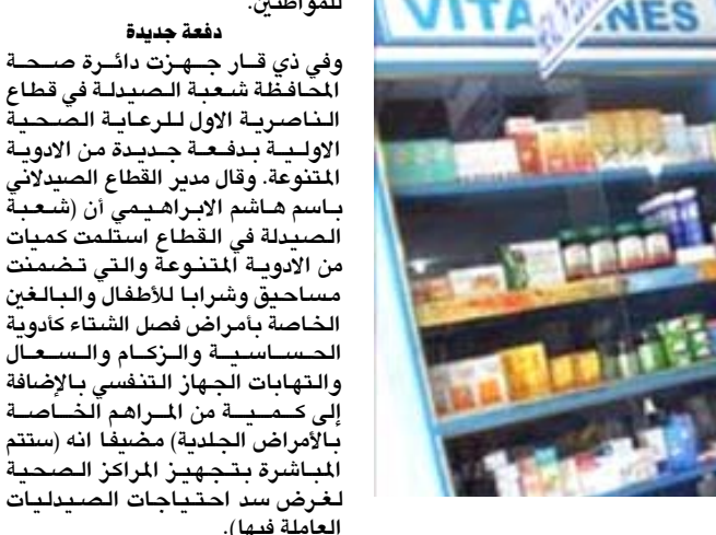
إمتلاء : صيدلية عامة تمتلئ بالأدوية

بأسعار مدعومة ووفق آلية معينة)، وذكر ان (الدائرة قامت بتوفير معظم الأدوية خلال العام الماضي وضمن خطة الدائرة لهذا العام تم توفير جميع انواع الأدوية التي لا تستطيع الشركة العامة لتسويق الأدوية