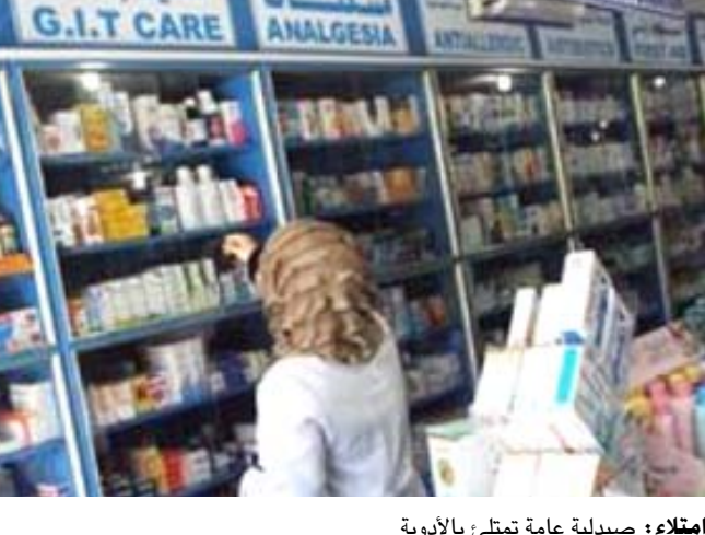
إمتلاء : صيدلية عامة تمتلئ بالأدوية

بأسعار مدعومة ووفق آلية معينة)، وذكر ان (الدائرة قامت بتوفير معظم الأدوية خلال العام الماضي وضمن خطة الدائرة لهذا العام تم توفير جميع انواع الأدوية التي لا تستطيع الشركة العامة لتسويق الأدوية