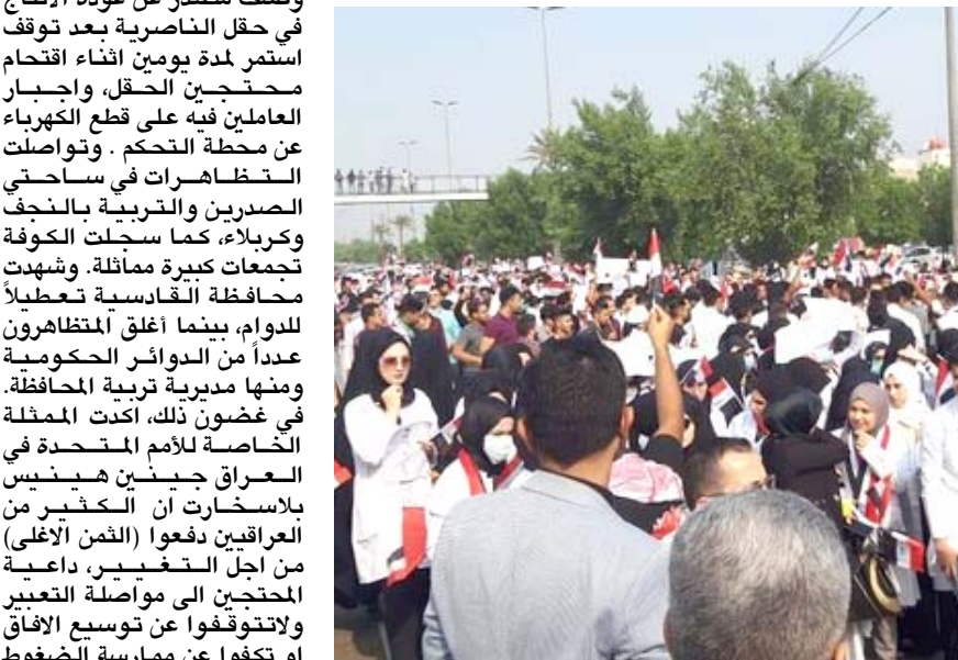
احتجاجات: تظاهرة طلابية في قضاء الهندية تطالب برحيل الفاسدين

تدخلات خارجية. وتجددت التظاهرات في محافظة ذي قار وتحديداً في مدن الناصرية والرافدان والفاقي. وأكد شهود عيان ان (متظاهرين أقدموا على قطع عدد من الطرق الرئيسية والجسور ومنها تقاطع البهو وجسر الزيتون والنصر والحضاربات وسط شعارات مناهضة للأحزاب). وكثف مصدر عن عودة الإنتاج في حقل الناصرية بعد توقف مستمر لمدة يومين أثناء اقتحام محتجين الحقل، واجبار العاملين فيه على قطع الكهرباء عن محطة التحكم. وتواصلت التظاهرات في ساحتي الصبرين والتربية بالنخف وكربلاء، كما سجلت الكوفة تجمعات كبيرة ممانلة. وشهدت محافظة القادسية تعطيلاً للدوام، بينما أغلق المتظاهرون عدداً من الدوائر الحكومية ومنها مديرية تربية المحافظة. في غضون ذلك، أكدت الممثلة الخاصة للأمم المتحدة في العراق جينين هينيس بلاسخارت أن التخفير من العراقيين دفعوا (الفن الأغلي) من أجل التخفير، داعية المحتجين الى مواصلة التعبير ولا تتوقفوا عن توسيع الأفق لتنفوا عن ممارسة الضغوط اللازمة، فالعالم بحاجة الى ذلك.