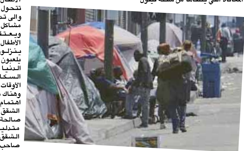
مخيمات قرب محال ودور سكنية

يقع سكني مباشرة على الشارع العام ومنذ الساعة الخامسة فجرا او اقل تبدأ السيارات بالوقوف على الشارع ويصرخ سائقوها منادين على الركاب بالذهاب الى المنطقة الفلانية.. وهذا الامر المزعج يأتي نتيجة عدم الالتزام بالذهاب الى المرائب ومحاوله الحصول على الركاب من اقرب نقطة..