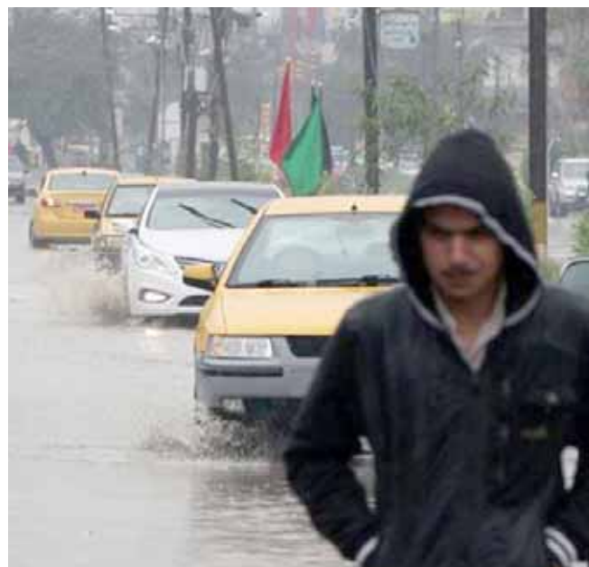
مياه الامطار تغمر شوارع بغداد

مناطق ومثل هذه الامور يجب ان تعد في المقدمة لان اتخاذ الاحتياطات امر