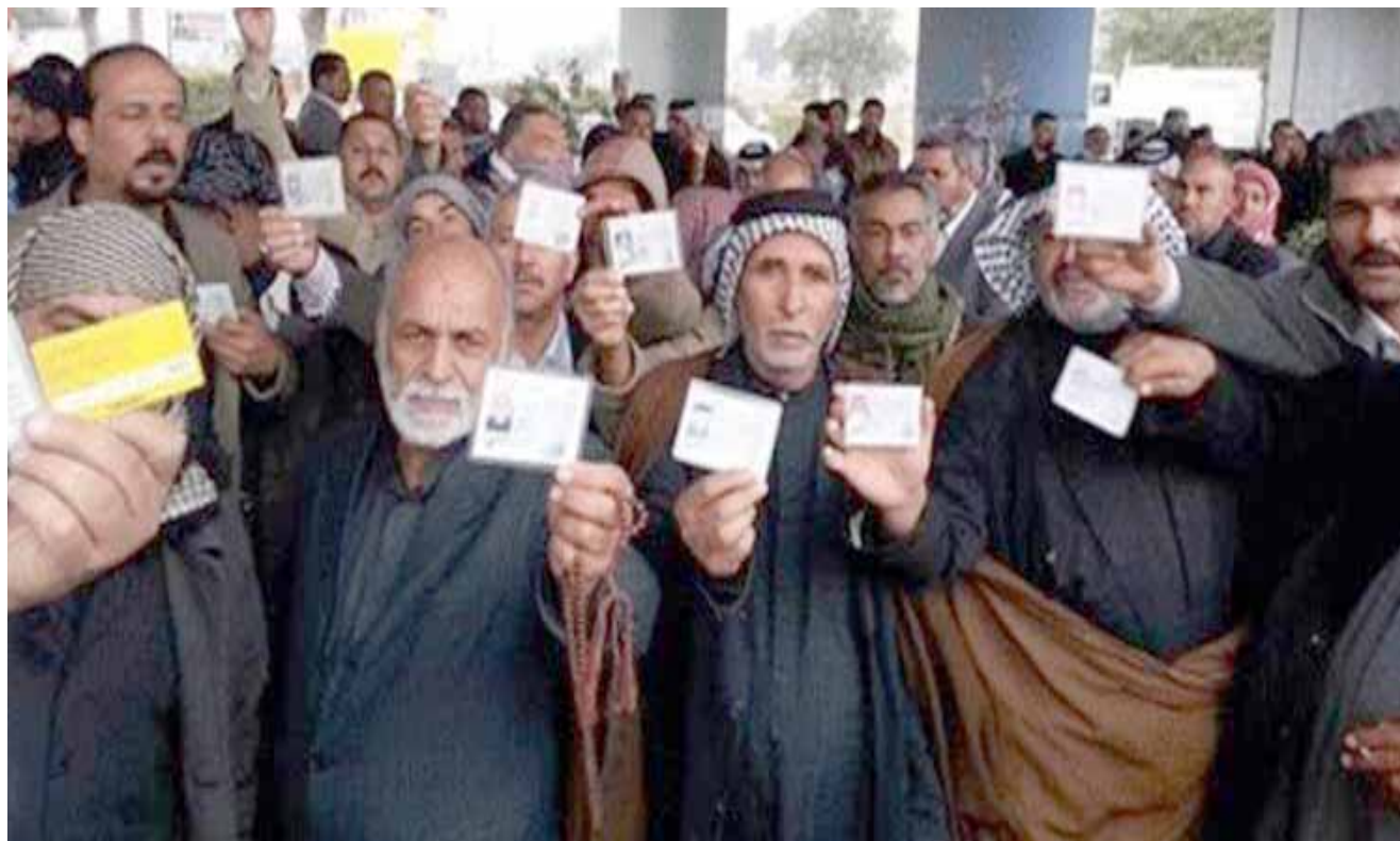
متقاعدون يرفعون بطاقات تقاعدية مطالبين باستبدالها

السادة رئيس وأعضاء اللجنة المالية المحترمين ذكرت المادة 4 من الدستور العراقيون متساوون امام القانون دون تمييز في كافة المجالات ومن ضمنها المجال الاقتصادي وهذا يتطلب تعديل المادة 35 -عاشرا من قانون التقاعد الموحد رقم 9 لسنة 2014. ومنح خريجي الدراسة الإعدادية مخصصات شهادة نسبتها 25 بالمئة خمسة وعشرون بالمئة من الراتب التقاعدي مع زيادة مخصصات حاملي الشهادات الأخرى نفس النسبة اي 25 بالمئة ايضا لكي تسود العدالة وتم المساواة ولكم الشكر والتقدير المادة 11 اولا مخصصات الشهادات الوظيفية 2- المادة 35عاشرا مخصصات الشهادات التقاعدية المادة 11- اولاً - بغداد