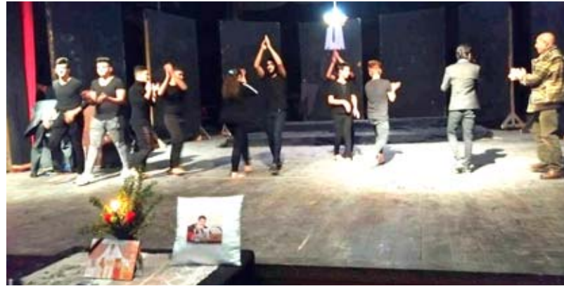
فعالية: طلبة الفنون يقدمون عرضاً مسرحياً في ختام تأبين أستاذهم