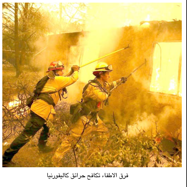
فرق الاطفاء، تكافح حرائق كاليفورنيا

لويس أنجليس (أ ف ب) - توصلت مجموعة عملاقة للطاقة في كاليفورنيا إلى تسوية بنحو 7.7 مليار دولار مع جهات تنظيمية على خلفية مسؤوليتها في التسبب بحرائق غابات عامي 2017 و2018. وأقعت أكثر من 100 اقتسبل في المجموع. وكانت أعطال في خطوط مدتها شركة باسيفيك للغاز والكهرباء تسببت باندلاع حريق كامب فاير في شمال كاليفورنيا، والذي اعتبر الأكثر دموية في التاريخ الحديث للولاية. ويوجب التسوية التي