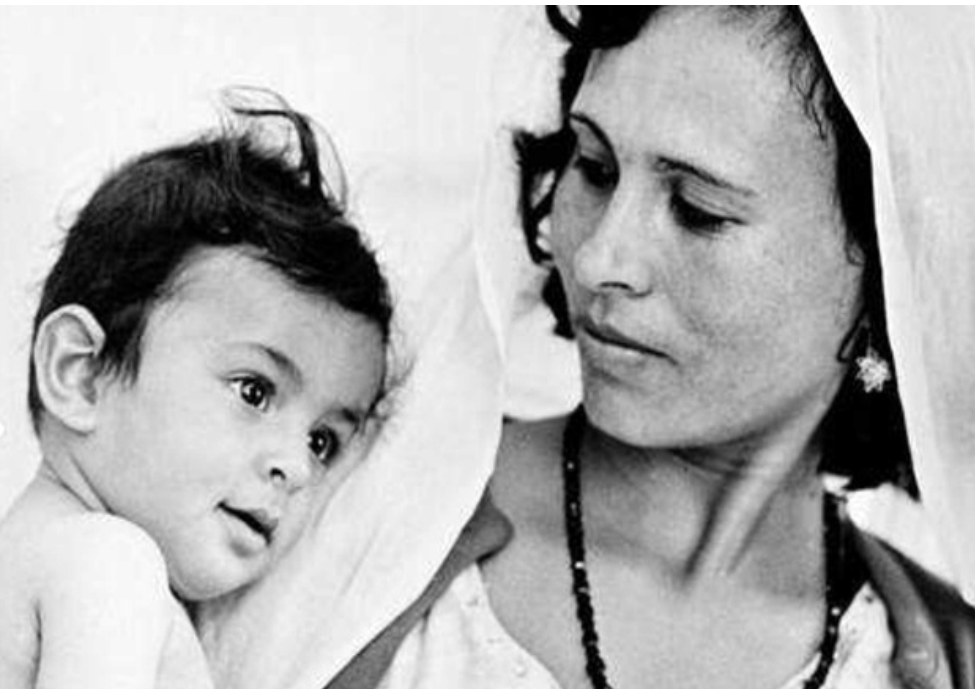
لجنة فلسطينية تحمل طفلها

وقد حدثت تغيرات بالفعل لكن غاياتها ظلت محدودة. تحولت الخيام التي أقيمت من الخيش في بيوت عام 1948 إلى بيوت مبنية بمواد بسيطة وأضحت الشواطئ أزقة لا ترى الشمس. وأصبحت الشابات اللاتي كن يحملن جرار الماء فوق رؤوسهن في غزة خلال الخمسينيات من الجدات لحيل