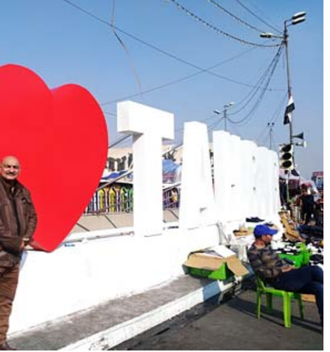
مجمع (الزمان) أمام مجسم أنجزه المتظاهرون وسط ساحة التحرير للتعبير عن حبهن للمكان

بغداد - حمدي العطار اشاد الجميع بما فيهم الطبقة السياسية، التي خرجت ضدها المتظاهرات، بمقدار الوعي لدى المتظاهرين والنزعة السلمية للتحركات، اما اعمال الحرق والتخريب فلا يحملها المتظاهرون السلميون بل هم المدمنون او ما