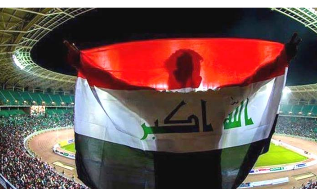
ملعب المدينة الرياضية في البصرة

ببغداد- الزمان أكد نائب رئيس الاتحاد الخليجي لكرة القدم جاسم الشكيلي ان النسخة الـ 24 من بطولة كأس خليجي 24 حلت في أهداف المنتخب الخليجي بالنظر عن الجانب التنافسي بغض النظر عن الخسارة. وعن بدء الإجراءات التي تخص تضيف النسخة المقبلة من البطولة خليجي 25 المقررة في البصرة، قال الشكيلي: فور انتهاء البطولة الحالية ستبدأ الإجراءات الخاصة باستضافة البطولة المقبلة. وحول موعد البطولة، قال الشكيلي ان