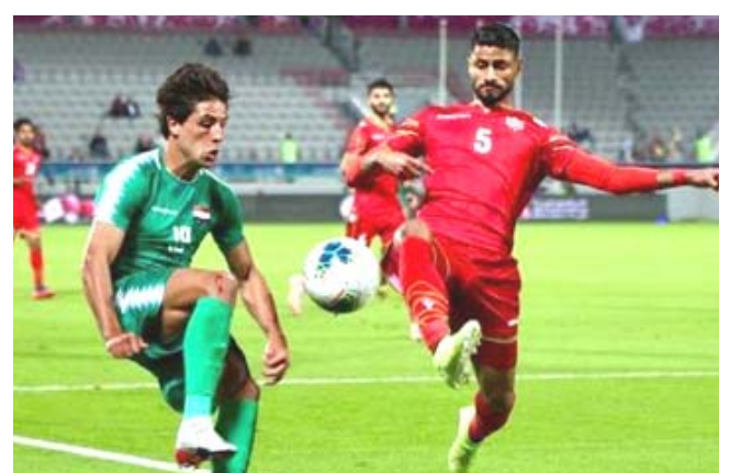
لقطة من مباراة المنتخب الوطني في خليجي 24

في البطولة وخرج من نصف النهائي بركات الترجيح. وهذه المؤشرات دليل على ان كاتانيتش نجح إلى حد كبير في ترتيب أوراق الفريق رغم وجود متوقف منذ شهرين تقريبا. وبالتالي حصل كاتانيتش على فرصته جيدة للحفاظ على جاهزية اللاعبين.