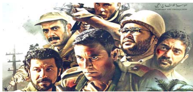
المصق الترويجي لفيلم (الممر)