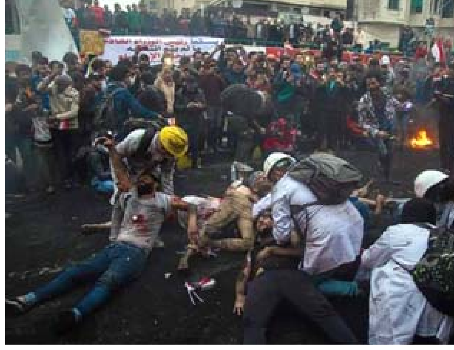
مسرح الثورة: اللصق التراجيدي لمسرحية (لا ما نتعب) ومشهد منها