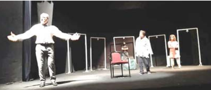
مشهد من مسرحية (أمكنة إسماعيل)