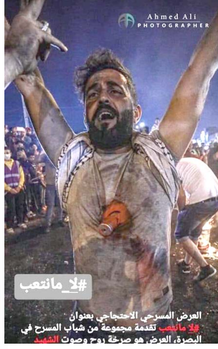
العرض المسرحي الاحتجاجي بعنوان ولا ماتعيب هو صرخة روح وصوت الشهيد للصدرة، العرض، هو صرخة روح وصوت الشهيد