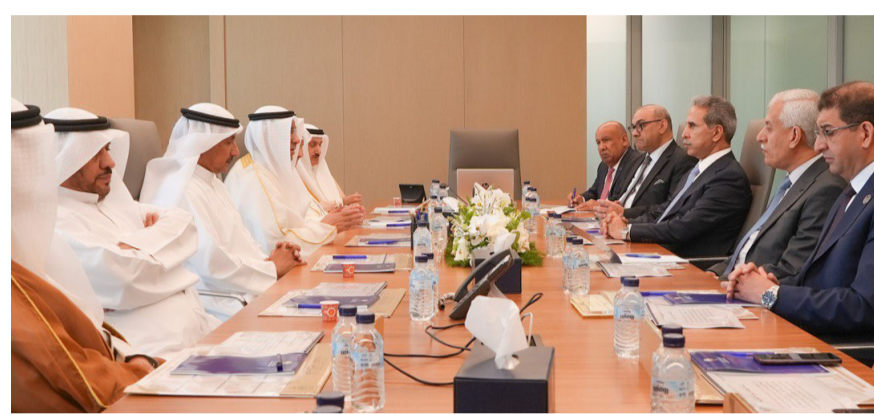
مباحثات : الجانبان القضائيان العراقي والكويتي خلال مباحثاتهما في الكويت

عراقية)، وشدد على القول إن (الكويت مطالبة بالدعوة إلى مفاوضات رابعة مع العراق والسعودية وإيران بشأن حقل غاز الدرة وأراضٍ وحملات طوية (واحد، مبيضا إن (الحقل يمتد ضمن مناطق اقتصادية خاصة تقاطع فيها حدود هذه الدول)، مجددا تأكيد إن (التفاوض بشأن حقول النفط والغاز المشتركة، مثل النوخذة وجمال طوية الثاني، ضرورة عملية، وتدعو الكويت إلى التقدم بطلب رسمي بشأنها)، وطالب بـ (وجوب وقف كافة عمليات الاستخراج من الحقول والآبار النفطية الحدودية المشتركة، كما ينبغي إهمال نتائج اللجنة الفنية منذ 2012 وحتى الآن، وكذلك الإعلان عن كميات النفط المستخرجة منذ عام 1980 وتجميد عائداتها إلى حين التوصل إلى اتفاق منصف، مقترحا (إعادة النظر بقرار مجلس الأمن الدولي