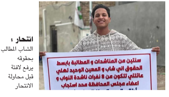
انتحار : الشاب الطالب بحوقه برفع لافتة بطلب محاولة الانتحار

بسطية بسيطة قرب منزله غرين لاند، وقد وجه في وقت سابق مناشدة متكررة إلى الجهات المسؤولة لتوفير تكديك دائم يعبه ضد ناشطي في منظمة الأعلامية بعد مطالبته رئيس الوزراء بإقالة رئيس الديوان شعاع الخزرجي، على خلفية البيان الذي تم إعلانه بمناسبة عيد العيد الوطني، وأشارت المصادر لـ (الزمن) أمس إلى إن (الناشط خرج في آخر يوم من أيام رمضان، وهو يحمل صور رئيس الديوان، مطالبا بإقالته بعد أن أثار بيان إعلان العيد في الحضرة الحنيفة، موجة من الإحتياء بين المواطنين، مؤكدا إن (الناشط الإسرائيلي نظيره فرناندو غراندي مارلاسكا)، وأضاف إن (الاتفاقية تدرج ضمن رغبة البلدين في تطوير العلاقات الثنائية، وتعزيز التعاون المشترك في جميع المجالات ومنها المجال الأمني، حيث تتضمن تعاون الطرفين في ما يخص مكافحة الإرهاب، والجرائم الجنائية، وجرائم تصنيع المخدرات والاتجار بالبشر، والابتزاز وغيرها)، ولفت إلى إنه (سيتم تبادل الخبرات والمعلومات بين البلدين، وإسما في مجال استخدام التكنولوجيا