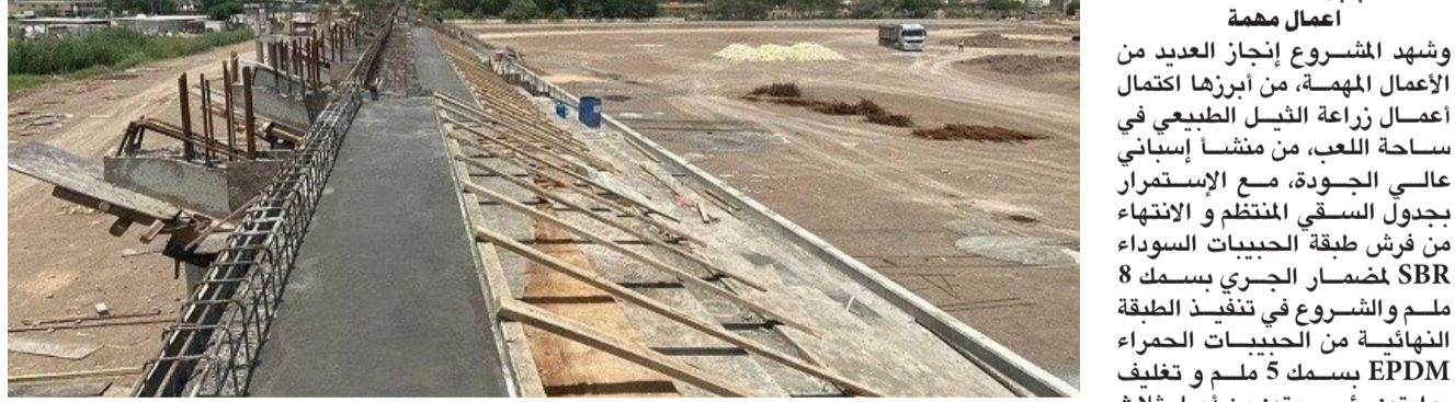
مشروع المسيب الأولي

أعمال مهمة وشهد المشروع إنجاز العديد من الأعمال المهمة، من أبرزها إكمال أعمال زراة التبل الطبيعي في ساحة اللعب، من منشأ إسباني عالي الجودة، مع الإستمرار بجداول السقي المنتظم و الإنتهاء من فرش طبقة الحبيبات السوداء SBR لمضمار الجري بسمك 8 ملم والشروع في تنفيذ الطبقة النهائية من الحبيبات الحمراء EPDM بسمك 5 ملم وتغليف بوابتين رئيسيتين من أصل ثلاث بوابات للمدخل، والانتهاء من