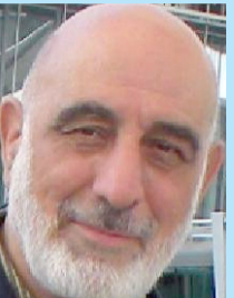
زهر غام الدباغ