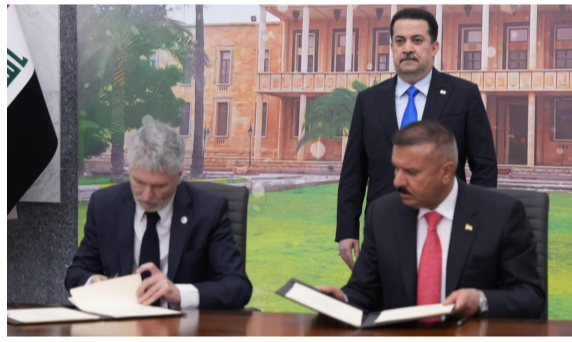
توقيع : وزير الداخلية ونظيره الإسباني يوقعان اتفاقية أمنية

الاستراتيجي)، مرحبا (بالزيارة المرتقبة للرئيس الفرنسي إلى العراق، كما أكد التقارب في وجهات النظر بين العراق وفرنسا في ما يتعلق بالمنطقة)، وأشار السوداني إلى (رغبة العراق بعقد منتدى الأعمال العراقي الفرنسي في بغداد)، مشددا على (أهمية الاستقرار في المنطقة وفي سوريا على وجه الخصوص، وضرورة اعتماد مبدأ المواطنة والعيش السلمي، ومشاركة جميع المكونات في حكم البلد)، مؤكدا (دعم استقرار العراق من جانب، ونقل بارو لرئيس الوزراء (تحتيات ماكرون، وأشار بما قام به خلال عمر الحكومة التي تحول فيها العراق إلى بلد تاجح وجاذب للعمل الاستثماري، ما يرفع مؤشرات في التصنيفات الإمتة)، مؤكدا (تنسيق المواقف مع العراق كونه بلدا محوريا، وتعزيز العلاقات معه، وإسما في الجانب الاقتصادي، وتشجيع بلاده للشركات الفرنسية للعمل بالعراق)، ولفت إلى (التزام حكومته بالتعاون العسكري والإمني ومكافحة الإرهاب في ضوء الاتفاقيات الثنائية الموقعة الخاصة بالتجهيزات العسكرية).