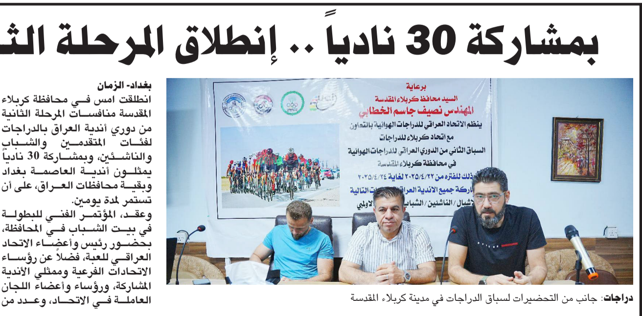
دراجات، جانب من التحضيرات لسباق الدراجات في مدينة كربلاء المقدسة