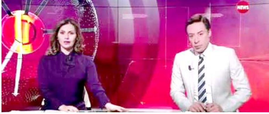
حصار (الشرقية نيوز) يتابع احتجاجات تشرين