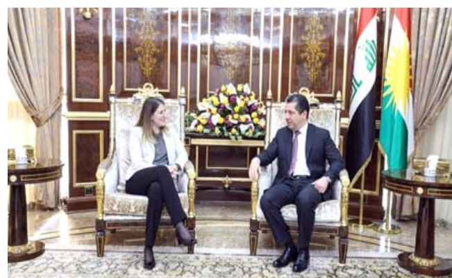
استقبال، مسرور البارزاني يستقبل مسؤولة بريطانية

الولايات المتحدة لإقليم كردستان، وأشار إلى أن زيارة نائب الرئيس الأمريكي مايك بنس إلى أربيل جاءت لتبرهن ذلك. وقال بيان تلقته (الزمان) أمس أنه خلال اللقاء الذي حضره وزير شؤون البشمركة شرواح اسماعيل والداخلية بيبر احمد، حدد وكيل وزارة الدفاع الأمريكية السياسات دعم