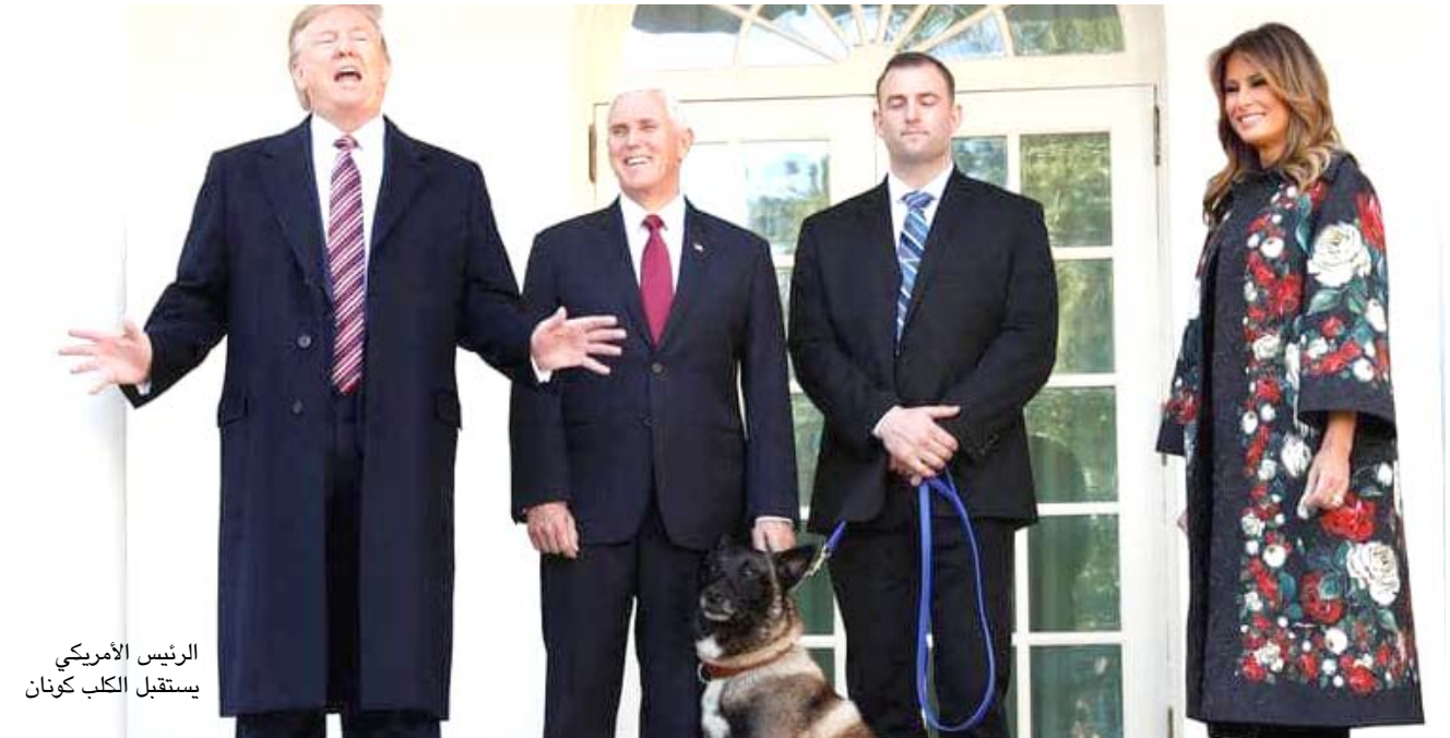
الرئيس الأمريكي يستقبل الكلب كونان