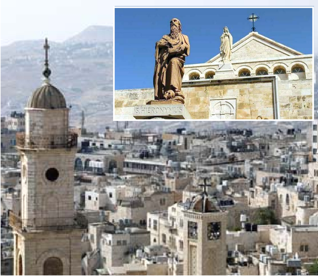
مشهد لمدينة بيت لحم في فلسطين

ناشغل وكالات - أشارت مراجعة بحثية إلى (أن من يتناولون المزيد من الألياف واللبن (الزبادي) قد يكونون أقل عرضة للإصابة بسرطان الرئة حتى وإن كانوا مدخنين مقارنة بمن لا يستهلكون الكثير من هذه الأطعمة) ودرس الباحثون بيانات عشر دراسات سابقة شملت نحو 45.4 مليون شخص بالغ في آسيا وأوروبا والولايات المتحدة. وبعد متابعة على مدى 8.6 عام في المتوسط تم توثيق 18822 حالة إصابة بسرطان الرئة. ومقارنة بمن لم يتناولوا اللبن الزبادي على الإطلاق، كان من استهلكوا أكبر قدر منه أقل عرضة بنسبة 19 في المئة للإصابة بسرطان الرئة. وقال الباحثون في دراستهم التي نشرت في دورية الجمعية الطبية الأمريكية لطب الأورام (أنه تبين أن من تناولوا أكبر قدر من الألياف الغذائية كانوا أقل عرضة بنسبة 17 بالمائة للإصابة بسرطان الرئة. أما من تناولوا أكبر قدر من الألياف وأعلى كمية من اللبن فكانت نسبة إصابتهم بسرطان الرئة أقل 33 بالمائة عن تناولوا أقل قدر منهما). وكتبت الدكتورة شيوا أو شو من المركز الطبي التابع لجامعة فاندريلت في ناشفيل بولاية تينيسي وزملائها في البحث (تشير دراستنا إلى فائدة صحية جديدة محتملة لزيادة الألياف واللبن في الغذاء في مجال الوقاية من سرطان الرئة). وطلت الصلة قائمة بين انخفاض احتمالات الإصابة بسرطان الرئة وبين تناول المزيد من الألياف واللبن حتى بعدما رصد الباحثون عادات التدخين. وخلفت الدراسة إلى أن من لم يسبق لهم التدخين تقل احتمالات إصابتهم بسرطان الرئة بنسبة 31 بالمائة عند تناولهم أعلى مقدار من الألياف واللبن مقارنة مع 24 بالمائة عند المدخنين و34 بالمائة عند المدخنين السابقين.