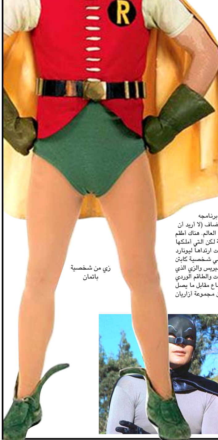
زني من شخصية باتمان