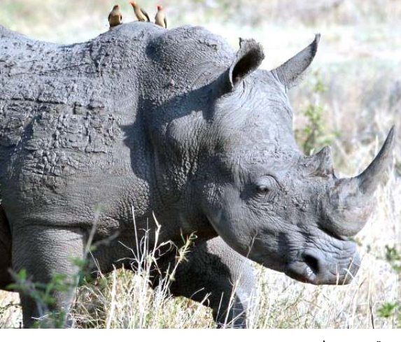
وحيد قرن سومطري

كنا نعلم أنها ستبدا في الشعور بالم كبير). وأعلنت ماليزيا أن وحيد القرن السومطري صار منقرضاً لديها عام 2015، ونفق آخر ذكر وحيد قرن سومطري في ماليزيا في أيار. ويحصب تقديرات المعنيين بالحفاظ على البيئة بعيش حالياً عدد يتراوح بين 30 و 80 وحيد قرن سومطري، معظمها في جزيرة سومطرة الإندونيسية والشاطر الطبيعية منذ اصطفاها في عام 2014. وقال مدير إدارة الحياة البرية في ولاية صباح أوجستين توجا (موت إيمان القرن السومطري بحوزتها لكن دون جدوى.