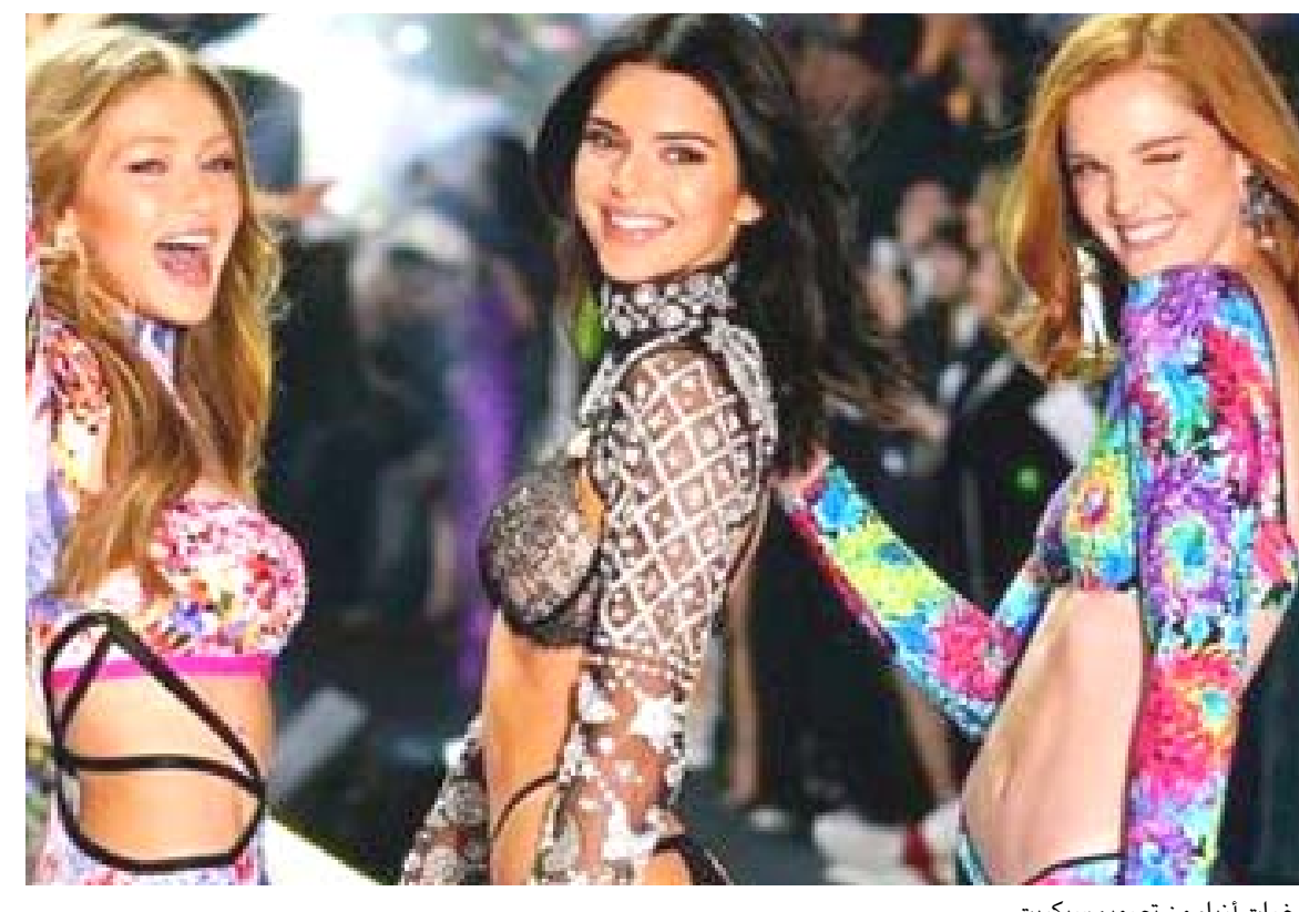
عارضات أزياء من تصميم سيكرت

عارضات الأزياء في العالم، وغالبا ما يرتدين تصميماً فنية تحتوي على الكثير من التفاصيل. ومثل عرض الأزياء علامة فارقة في حياة العديد من العارضات العاليتين بما في ذلك تايرا بانكس وهايدي كلام وميراندا كير وبيجو أن تغير توجهات الجمهور تجاه مثل هذه العروض قد أثرت على مبيعات الدار وعلى العلامة التجارية ككل. فقد أثرت المبيعات الضعيفة لفيكتوريا سيكرت على أداء الشركة الأم إن برانز، حيث سجلت خسارة إجمالية في مبيعات الربع الثالث، التي أعلن عنها هذا الأسبوع، قدرت بـ 252 مليون دولار، كما واجهت العلامة التجارية للملابس الداخلية أيضاً عهداً من الخلافات في الفترة الأخيرة. ففي العام الماضي، أثار تصريح أدلى به مدير التسويق السابق في الشركة، إد رازق، مجلة فوغ، ريوه فعل غاضبة، حيث قال (إن العارضات المحولات جنسيا ليس لهن مكان في عروض أزياء الشركة). واعتذر رازق في وقت لاحق عن هذه التصريحات وغادر الشركة في وقت سابق من هذا العام، كما تأثرت سمعة شركة إن برانز أيضاً بسبب صداقة مؤسسها الملياردير لي وكسبر مع خبير المال الأمريكي الراحل جيفري إبستين. وقد انتشر إبستين في زنازاة السجن في اب من هذا العام بينما كان ينتظر المحاكمة بتهمته الاتجار بالبشر. وكان وكسبر قد عين إبستين مستشاراً له، لكنه قطع علاقته به بـ 2007 واتهمه باختلاس أموال من الشركة.