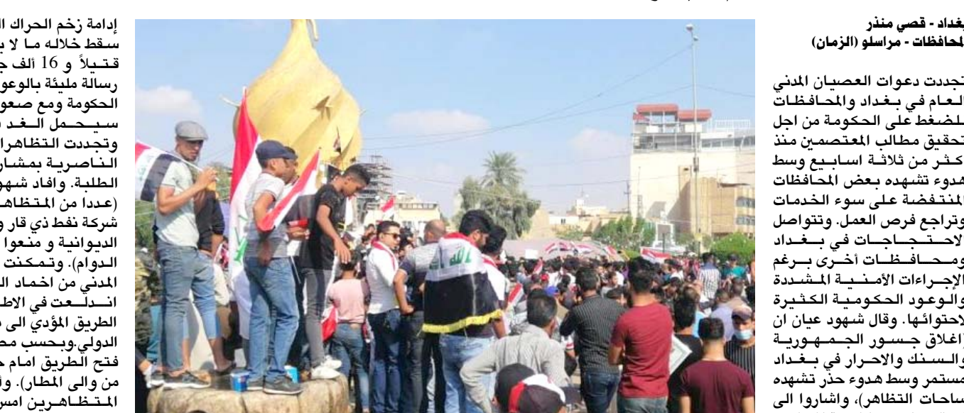
اعتصام: طلبة كربلاء يعتصمون مع المتظاهرين في ساحة التربية وسط المدينة

هذا الكتل تتحمل مسؤولية ما يجري حالياً كونها أسهمت بتشكيل الكابينة الوزارية وكانت تفرض حصتها من المناصب على الحكومات السابقة كما حولت الوزارات إلى أقطاعات تابعة لها). وأضاف (نأمل ان تفوضى مخرجات اجتماعات الكتل التي حلول ترضي مطالب المحتجين والمرجععية دون تسويق أو مطاطلة، أما اذا انتهت المهلة التي حددتها الحكومة والبرلمان دون تحقق شيئاً، فسيتكون للشارع موقف اخر). وأكد ان (الجماهير تطالب بان يكون قانون الانتخابات من خارج ويسمح للنخب من خارج المنظومة الضمنية الوصول إلى مجلس النواب إضافة إلى إلغاء المفوضية الخامسة للأحزاب والحكمة واتتالف الوطنية