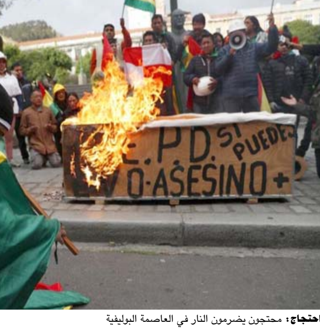
احتجاجاً محتجون يضرمون النار في العاصمة البوليفية

وقال ميسا في تصريحات سابقة 'نرى ان على الرئيس موراليس اتخاذ هذا القرار. إذا كان يتمتع بحذ أدنى من الوطنية عليه الانسحاب.'