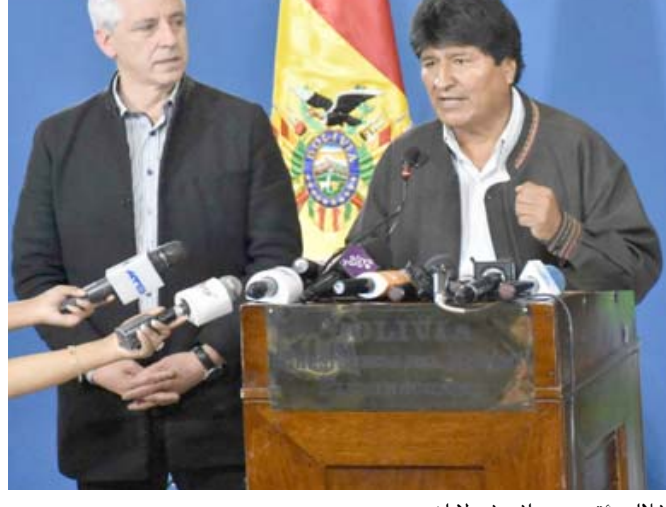
مؤتمراً الرئيس البوليفي إيفو موراليس خلال مؤتمر صحافي في لا باز

الأول/أكتوبر إلى إعادة انتخاب موراليس لولاية رابعة حتى 2025 رغم أن البوليفيين رفضوا هذا الخيار في استفتاء جرى في شباط/فبراير 2016.