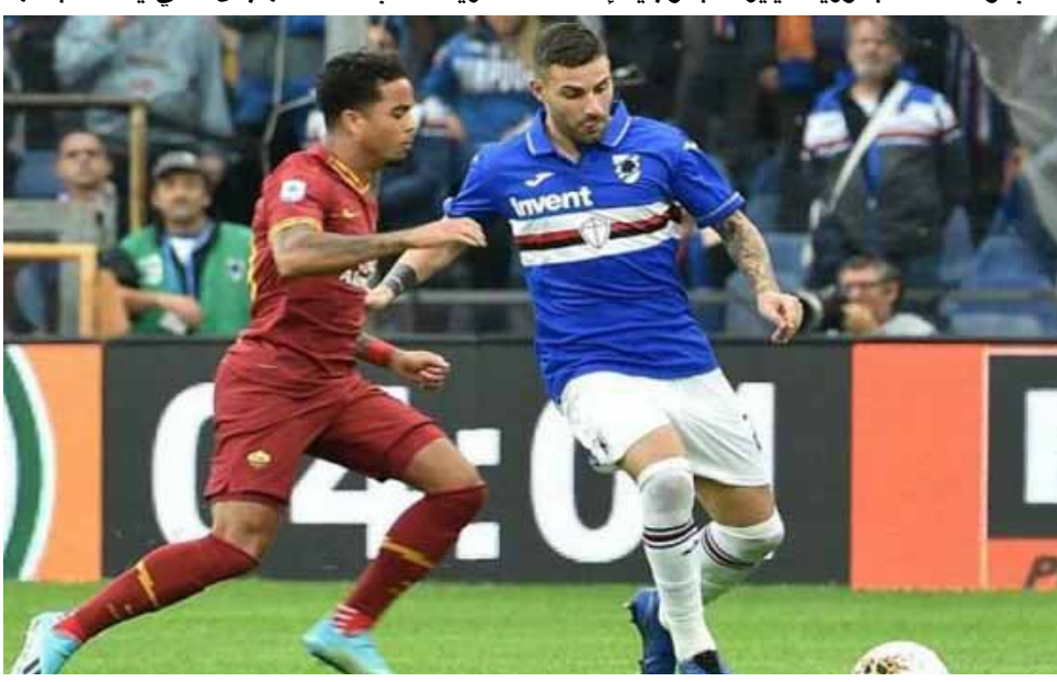
رونالدو فييرا تعرض للإساءة من جانب جماهير روما

وجه نادي روما اعتذاراً خاصاً للاعب وسط سامبدوريا فييرا