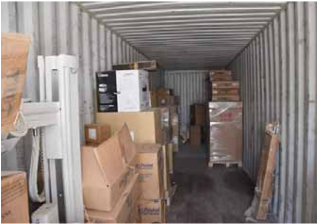
عيادات: اجهزة حديثة اى ديالى واجتماعات طبية وعلاجات في العيادات الشعبية ببغداد

سجلت الدائرة اكثر تسعة الاف مراجع خلال الشهر نفسه. وقال الجميلي ان العيادات واللجان الطبية في نيوى استقبلت 9377 مراجع خلال اب حيث بلغ مجرعي الامراض المزمنة 6409 والعامه 174 وتم عمل 590 بطاقة دوامه جديدة للمصابين باحد الامراض المزمنة،مضيفاً ان (اعداد المراجعين للجان السباقة والتعدين المسائفيه في نيوى بلغ 2764 مراجع. في غضون ذلك، أعلنت دائرة صحة ديالى عن تسلمها دفعة جديدة من الأجهزة الطبية الرقمية في بغداد من أجل اكمال تكنولوجيا المعلومات بقطاع صحة ومجالات عدة أبرزها الصحة والتعلیم. بحضور عدد من