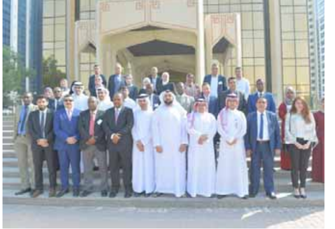
رقابة: المشاركون غب دورة الرقابة والإشراف على البنوك الإسلامية

تعليم الناس للقضاء على هذا المرض ، وكما ذكرت ان اللوبي الطبي لتصنيع الادوية اكر من اللوبي النظفي المسيطر على نغظ العالم بثلاثة مرات كما ذكر أحد الباحثين في كبرى الندوات الطبية ،،