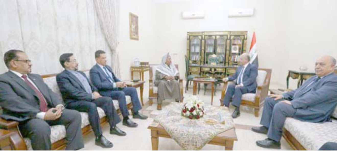
لقاء : رئيس الجمهورية برهم صالح خلال لقائه بأمين عام منظمة أوبك في بغداد امس الاول

بالبild في الاتجاه الصحيح) مبينا ان (ما تعرض له العراق لم يتعرض له أي بلد آخر على الإطلاق وهذا يستوجب الوضع الأمني في المحافظة بسبب ضعف القيادة الأمنية الموجودين في المحافظة). وطالب وزير الداخلية التدخل الفوري بـ (تغيير قائد الشرطة للخروقات المتكررة ومنها خلال الأسبوع الجاري قيام سيطرة وهمية بقتل سجناء). واعان مجلس محافظة ديالى ، عن اعمار اربعة جسور في قاطع شمال شرق المحافظة، مشيرا الى ان تلك الجسور ستوفر ممرات آمنة لاكثر من 75 ألف نسمة.