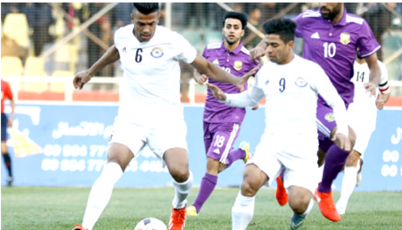
بورصة الإنتقالات: شهدت الإنتقالات إستقطابات عديدة للاعبين من قبل أندية المتاز

بغداد - صلاح عبد الهادي على امتداد الفترة الممتدة للمريكاتو الشتوي شهدت بورصة الإنتقالات حركة نشيطة أفضت الى الكثير من عمليات الحذف والإختلال التي خرجت بها الفرق المشاركة في دوري الكرة الممتاز بحثا عن نتائج أفضل في أتون الصراع التنافسي المحلي، (الزمن الرياضي) راقبت الصفقات الجديدة التي أبرمتها فرق الدوري وخبرجت بهذه الحصيلة: