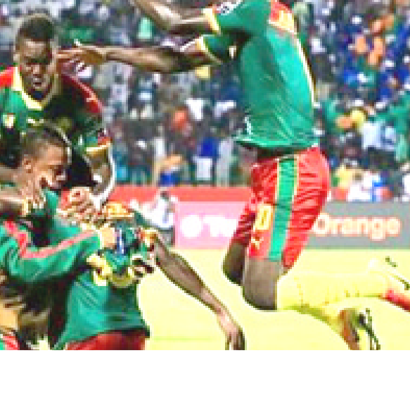
فرح كبير للمنتخب الكاميروني بعد الظفر بلقب أمم أفريقيا

ليصعد ببلايه إلى قبل نهائي كأس الامم حيث فاز المصريون بركلات الترجيح امام بوركينا