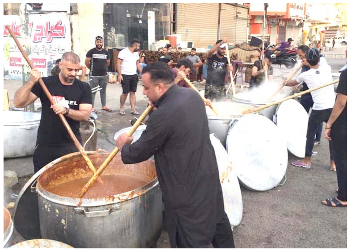
طبخ : شباب منطقة الأعظمية ببغداد يطبخون القيمة والتمن لتقدمها لزوار الكاظمية بذكرى عاشوراء