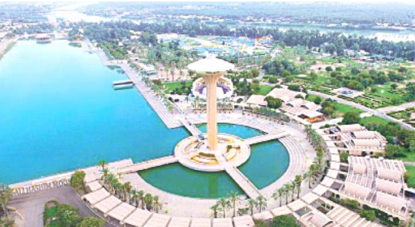
سياحة : لفتة جوية لجزيرة بغداد السياحية

متقدمة على ملبورن الأسترالية (98.4) التي بقيت لسنوات متصدرة للتصنيف وسيدني الأسترالية أيضاً (98.1) وهيمنت استراليا وكندا على تصنيف أفضل 10 مدن مع ثلاث مدن لكل منهما إلى جانب الصفر. وجاء ترتيب المدن