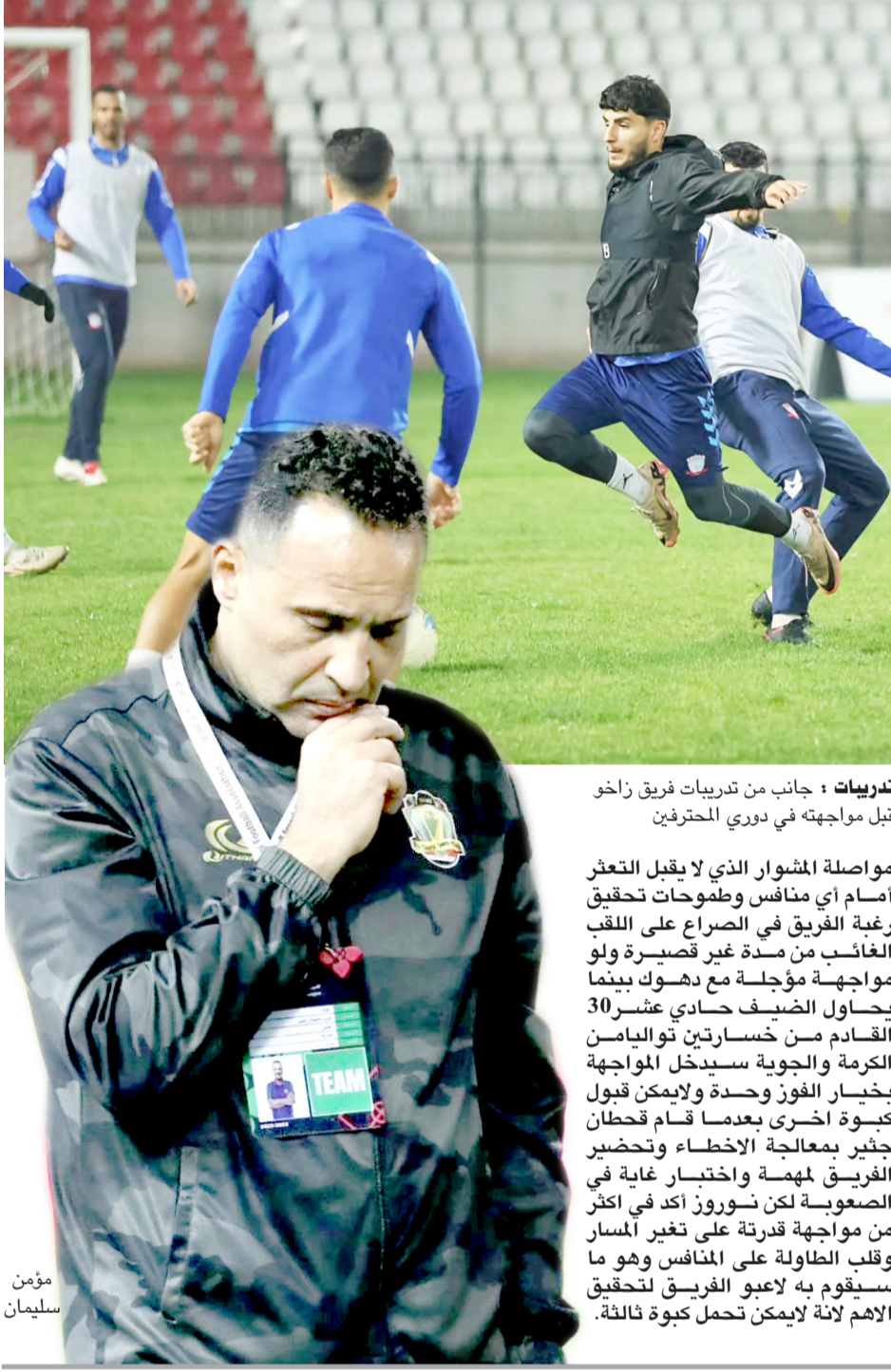
تدريبات ، جانب من تدريبات فريق زاخو قبل مواجهته في دوري المحترفين

مواصلة المشوار الذي لا يقبل التعثر أمام أي منافس وطموحات تحقيق رغبة الفريق في الصراع على اللقب الغائب من مدة غير قصيرة ولو مواجهة مؤجلة مع دسوك بينما يحاول الضيف حادي عشرين 30 القادم من خسارتين تواليهما الكرامة والجوية سيدخل المحاربة بخيار الفوز وحده ولا يمكن قبول كسوة أخرى بعدما قام قحطان حنجر بمعالجة الإخطاء وتحضير الفريق المهمة واختبار غاية في الصعوبة لكن نوروز أكد في أكثر من مواجهة قدرته على تغيير المسار وقلب الطاولة على المنافس وهو ما سيقوم به لاعبو الفريق لتحقيق الأهم لأنه لا يمكن تحمل كسوة ثالثة.