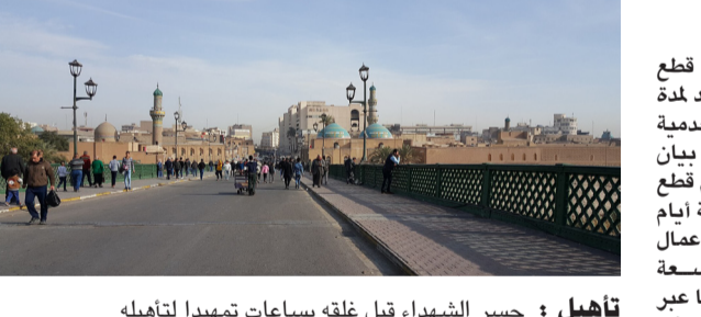
تاهيل: جسر الشهداء، قبل غلقه بساعات تمهيدا لتأهيله

تاهيل طريق الديوانية النجف، الذي وصل إلى مراحل إنجاز متقدمة وإنشاء العمر الثاني طريق الرمادي حديثة ومشروع إنشاء العمر الثاني طريق مفرق غماس الحمزة الشرقي في الديوانية ومشروع تاهيل طريق المرور السريع بغداد أبو غريب ومشروع تاهيل وصيانة طريق كركوك بغداد وإنشاء طريق شوملي القاسم وربطه مع طريق القاسم الكفل في محافظة بابل)، مضيفا (وكذلك إنشاء العمر الثاني طريق الحج البري ضمن المرحلة الثالثة ومشروع إنشاء جسر حمرين في محافظة ديالى ومشروع إنشاء العمر الثاني طريق البصرة بدة مهران في واسط ومشروع ربط الناصرية بطريق المرور السريع رقم واحد ومشروع إنشاء العمر الثاني طريق كسكس ربيعة في نضوى، وتاهيل وصيانة طريق المنزلية إمام ويس الفلطي في ديالى وإنشاء جسر الفلوجة الكونكريتي الرابع في الأنبار، الذي شارك في الإنشاء، إضافة إلى مشروع ربط جامعة الفلوجة بطريق المرور السريع).