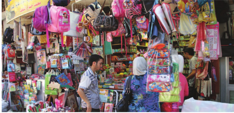
تبيع مواطن يتبع مستلزمات دراسية من أحد أسواق بغداد

صرفت الدولارات، اثر كثيراً على حركة السوق، ما أدى إلى رفع أسعار الدفاتر والكتب والقرطاسية وغيرها، مردفين بالقول أن استمرار الوضع بهذا الشكل يندب بالخطر، مطالبين الحكومة بالانقذات الى هذا الأمر بزجة في البرنامج الخدمي والتعليمي، لتأثيره على دخل المواطنين وقوتهم اليومي، الى ذلك عزأ اصحاب المكتبات هذه المشكلة الى ارتفاع الدولار مقابل الدينار الذي أدى بدوره الى ارتفاع بدلات الإيجار لأغلب المحال، مع ضعف قوة الشراء والبيع لنفس السبب.