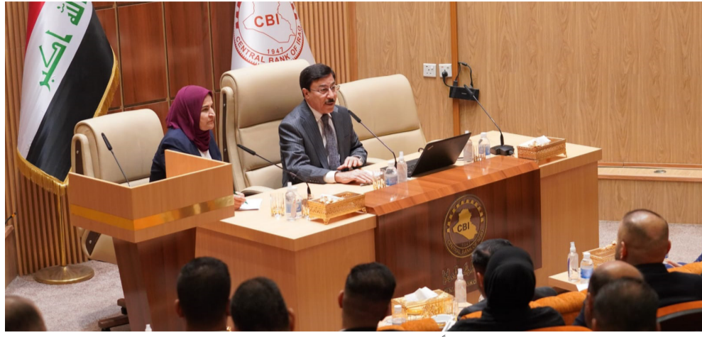
اجتماع محافظ البنك المركزي يترأس اجتماعاً لمناقشة تداعيات صرف العملة

ويقوم الأخير بمفاتحة البنك لتغذيته بالدولار بحسب السياقات القانونية المعمول بها، واستقرت أسعار صرف الدولار أمام الدينار المحلي في السوق الموازي. وأصدر مصدر بآن سعر البيع بلغ 155 ألف دينار، بينما بلغ الشراء 154 دينار لكل مئة دولار. إلى ذلك، ترأس رئيس الحكومة محمد شياع السوداني، اجتماعاً لمتابعة الدفع الإلكتروني. وقال بيان تلقته (الزمان) أمس إن (السوداني ترأس اجتماعاً خصص ليبحث ومتابعة خطوات تنفيذ حساب الخزينة الموحد، واستكمال تطبيق نقاط