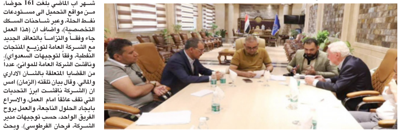
بعض : شركة الموائت تبحث مع شركة المانية تبادل الخبرات

التصاميم الأولية خلال شهر تشرين الأول من العام الجاري، مبيئا ان (المقطع الأول خصصت لتصاميمه من مدينة الفاو بمسافة تبلغ 150 كيلومترا)، وواضح ان (فرقا مشتركا من العراق وتركيا سيطلقان خلال زيارة ميدانية الى نقطة الالتقاء في منطقة قيسشاور، على تفاصيل الربط بين البلدين، لافتا الى ان (عمليات تحري