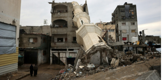
مخيم : مسجد مدمر في مخيم النصيرات وسط قطاع غزة