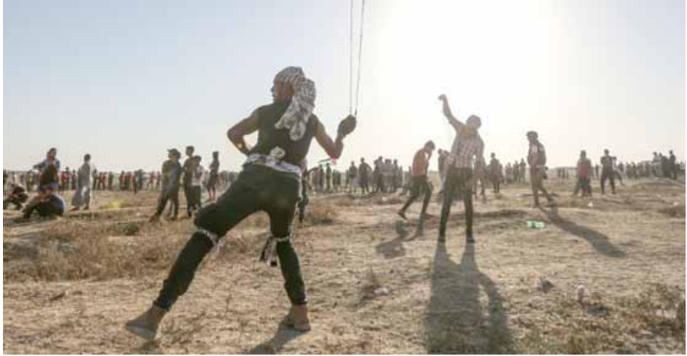
حدود: محتجون فلسطينيين أمام السياج الحدودي بين غزة وإسرائيل في شرقي القطاع

قتل ما لا يقل عن 305 فلسطينيين بنيران إسرائيلية في قطاع غزة والمنطقة الحدودية مع إسرائيل، وهي عملية مستمرة منذ عامين، في حين قتل خلال الفترة ذاتها سبعة في الجانب الإسرائيلي.