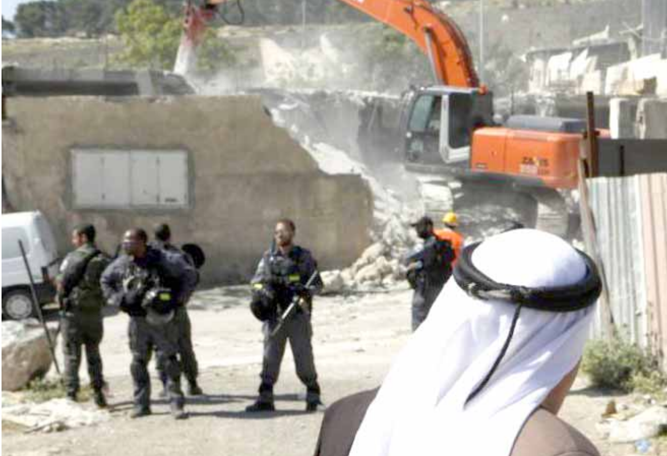
هدم: جنود اسرئائليون يهدمون منازل فلسطينية