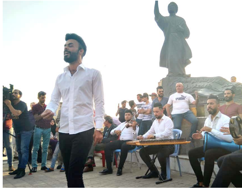
مساء المتنبى : موسيقى وغناء وجمهور في أمسية بشارع المتنبى