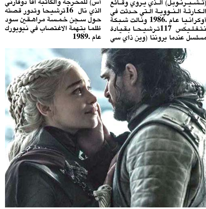
مشهد من (صراع العروش)