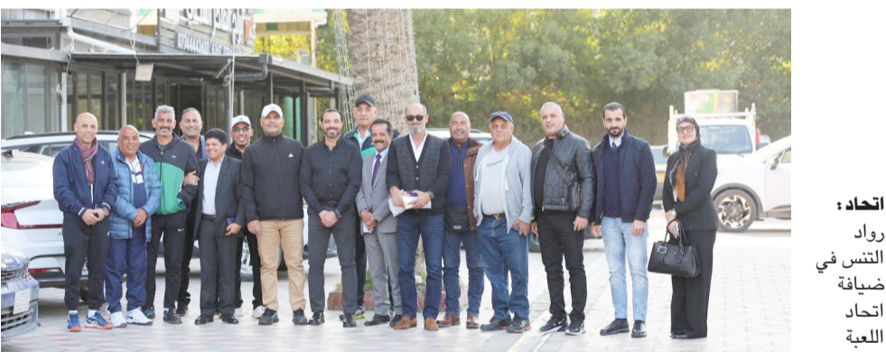
اتحاد: رواد التنس في صياغة اتحاد اللعبة

بمحاولة إيقاف الإنهيار من هذه الأوقات سعيًا لتغيير واقع الحال المترهل المثير لمخاوف جماهورة في إن يستمر الفريق في التراجع لضعف قدراته على البقاء في ظل تراجع المرود في وقت يرفض مدرب الزوراء إنهاء الجولة الرابعة من معنى في تقويت الفرصة على من يحاول التصيد في الماء العكر تحت عنوان «شجعين» لكن تبقى المشكلة الأكبر كيفية استعادة الصدارة وتتطلب عدم التفريط بهدف. ويحلّ الجهد ثاني عشر نوروز 27 ضيفاً على التذليل ديالى الأول فرض