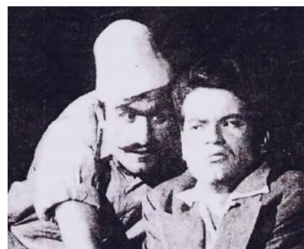
مسيرة: لقطات من مسيرة فاضل سوداني الفنية