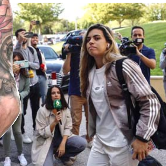
رحيل: لحظة رحيل لاعبتين من منتخب أسبانيا