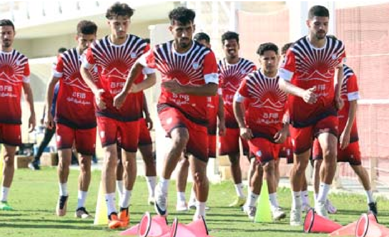
تدريبات فريق زاخو يواصل تدريباته استعدادا لدوري المحترفين

تدارك البقاء في الممتاز بعد محاولات مهمة من قبل الادارة عندما تمكنت من تفادي الخراجع الى مراكز المؤخرة وتدارك الامور في المرحلة الثانية وذلك بتغيير الجهاز الفني والاستعانة بعدد من الاعبين المحترفين وقبلها الاستقرار على المدرب السوري فجر الذي سار بالامور بشكل مقبول وحقق رغبة جمهوره الفريق بالبقاء في البطولة هدف المشاركة المطلوب قبل ان ينهي المسابقة في المركز الرابع عشر من الفوزين 10 المباريات والتعادل في 14 وخسر ايضا 14 مباراة ومهم ان تتعلم الادارة من درس المشاركة الاخيرة ونتيجة بشكل مختلف نحو الموسم المقبل حيث المشاركة باول دوري للمحترفين بالتعويل على قدرات المدرب القطري والاعبين الذين تم التعاقد معهم وان يكون الكل أكثر وضوحا وعطاءا لدعم الامور والاخذ فيها بالاتجاه الصحيح عبر بناء فريق متكامل من جميع الجانبات وان تتكاتف الجهود بوجود المجموعة التي اختيرت للدفاع عن ألوان الفريق وتحقيق طلععاته في مشاركة ناجحة بوجود الاسماء المؤثرة المحلية والمحترفة وبدعم جمهور النادي الكبير.