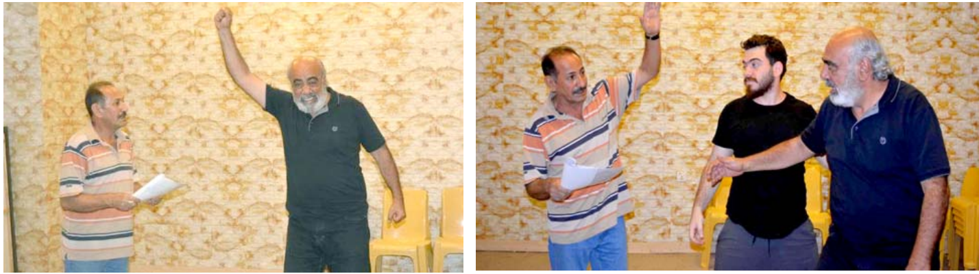
مسرحي؛ مونودراما (أنا ورأسي) ضمن مهرجان يوسف العاني الثالث

لم يكتمل في مرحلة الشباب، عندما كان قادراً على الحركة، ومن ثم أشير إلى ضرورة ان ينتمي المجتمع لهذه الأشكالية وخلق مؤسسة جديدة، تعتمد على أفكار الكبار وطاقة الشباب لبناء مستقبل جديد . مؤكد(بالإكديك لتخلو المسرحية من نقد لاداء السياسي، والحكومي والمجتمعي، حيث تتحمل الدولة جزءاً من المسؤولية إذ انها لاتعمل على إقامة مؤسسات ذات تنمية عقلية مستدامة بل تركت الأمور للقطرة وما يتمتع به الإنسان من موهبة عقلية، وهو امر يمكن الحصول على توييلاته من خلال فكرة ان الرأس هو المبر والمسير لذلك الجسد وكل شيء في الكون يتكون من رأس وجسد، حتى الدولة التي تتعامل اليوم مع الجسد وفق عقلية شيايبية متهوره فهي تنعم بالملذات مثلما يفعل الإنسان في صباه يجب ان تغادر المؤسسات الحكومية تلك العقلية وان تعلن مصالحة بين الرأس والجسد ان لا يمتنع ان يستغني الرأس عن الجسد والعكس صحيح).