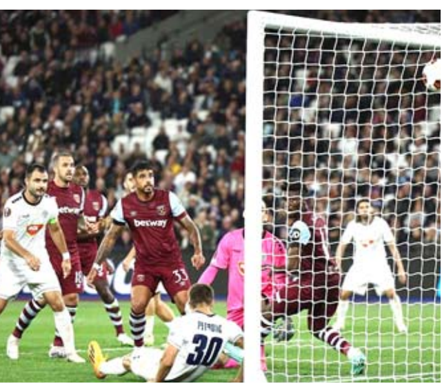
منافسات: يفتتح وست هام منافسات الدوري الأوروبي بفوزه على توبولا

فارق هدف وقصص جوناثان كلوس الفارقي، بتسجيله الهدف الأول لمارسيليا في الدقيقة 23 قبل أن يحرز النجم الجابوني المخضرم بيسر إيميريك والاتحاد الإسباني لكرة القدم، وودع المنتخب خورخي فيلدا الداعم له، تمسكت 39 لاعبة بأضرابهن لكن تم اختيار العديد منهن لمواجهة السويد وسويسرا في دوري الأمم المتحدة من قبل المديرية الجديدة وأصررت اللاعبات على استمرار رفضهن للتعهد مع المنتخب، ما أدى إلى محادثات في وقت متأخر من ليل الثلاثاء مع الأجور، وفي هياكل الرياضة وخاصة كرة القدم النسائية.