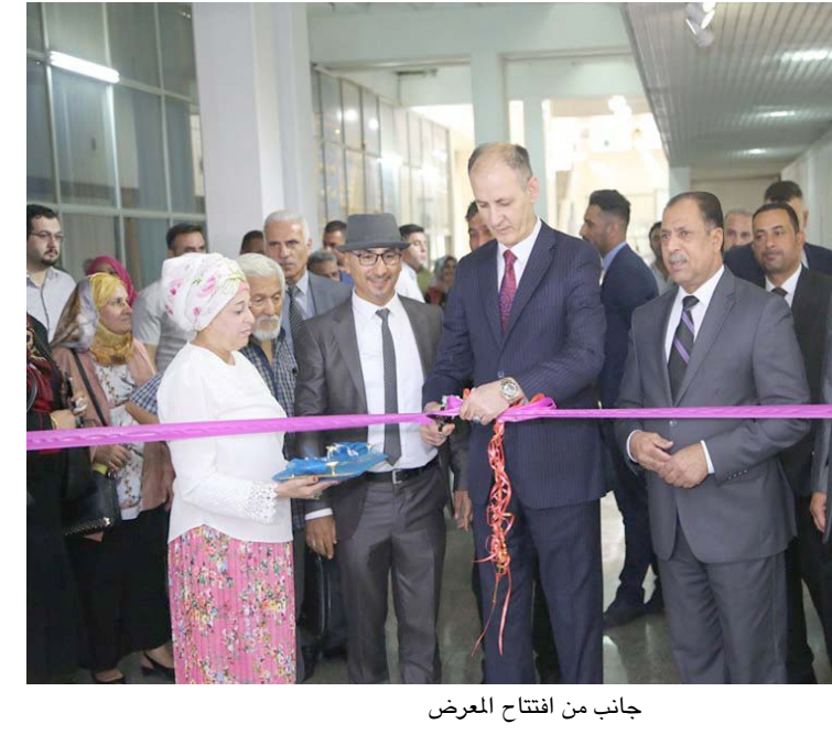
جانب من افتتاح المعرض

□ على مستوى المحافظات وعلى وجه أخص البصرة ، هل لديكم خطة طموح وكيفية دعمها ؟ □ بغية الانفتاح على النشاط الفني العراقي وبعيدا عن فكرة المركز ، وبعد استحصل موافقة ودعم الدكتور عبد الأمير الحمداني وزير الثقافة ، تدعو دائرتنا كافة الفنانين في مدننا الحبيبة الى المساهمة في احياء ليال عراقية تحت مسمى (ليالي البصرة -ليالي نينوى -