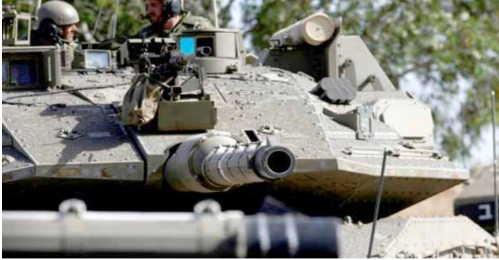
دهابة؛ جنود إسرائيليون على دبابة على هضبة الجولان

الأيض والبنادق ضد الجنود الإسرائيليين في الأراضي التي احتلتها إسرائيل عام 1967.