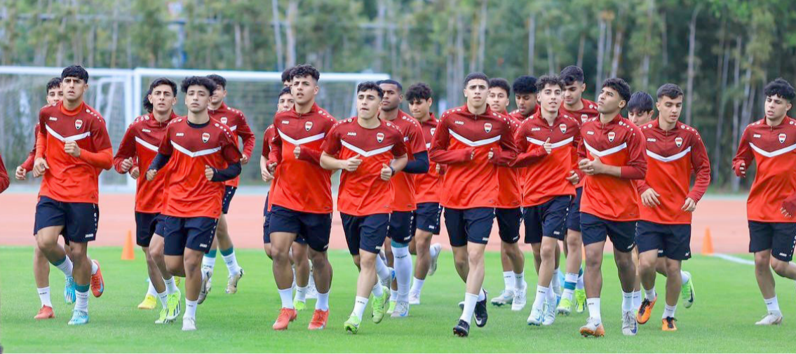
تدريبات: منتخب الشباب يجري تدريباته لخوض منافسات اسيا في الصين