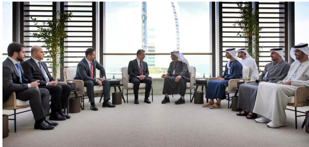
استقبال : رئيس دولة الإمارات العربية المتحدة يستقبل في دبي رئيس حكومة إقليم كردستان