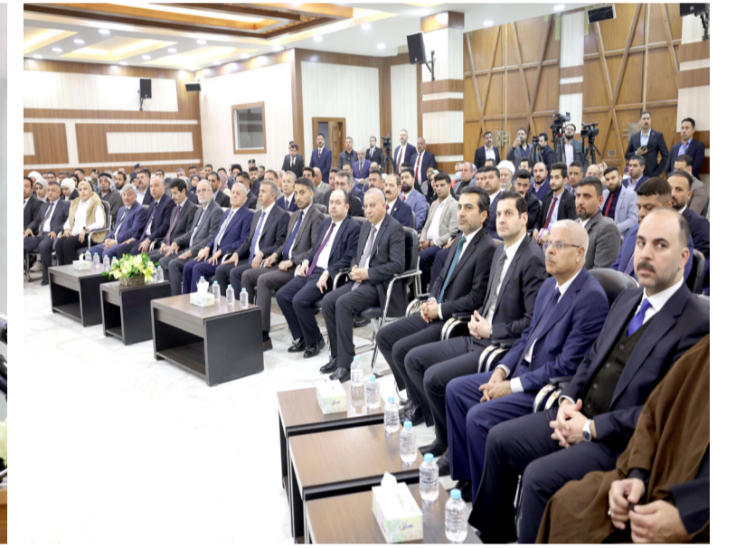
حضور، جانب من المحاضرة في معهد العلمين