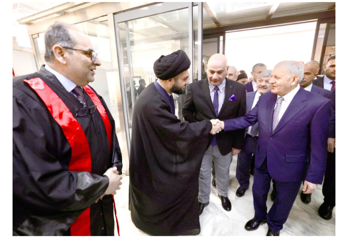
استقبال: ابراهيم بحر العلوم بـستقبل رئيس الجمهورية