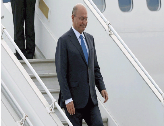
لندن - الزمان

بدأ رئيس الجمهورية برهم صالح أمس الثلاثاء زيارة إلى لندن تستغرق ثلاثة أيام يلتقي خلالها الملكة بريطانيا البريبيث وكبار المسؤولين وقال المكتب الاعلامي لرئيس الجمهورية في بيان ان (صالح بدأ زيارة إلى المملكة المتحدة تستغرق اياما عدة من المؤمل ان يلتقي خلالها بالملكة البريطانية، ورئيسة الوزراء ووزير الخارجية ورئيس مجلس اللوردات البريطاني، فضلا عن كبار المسؤولين البريطانيين) من دون تفاصيل.