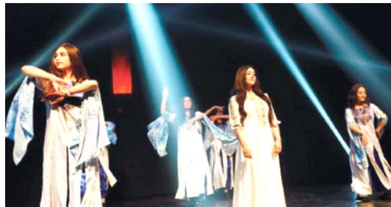
لقطة من الدورة الأولى لمهرجان رم