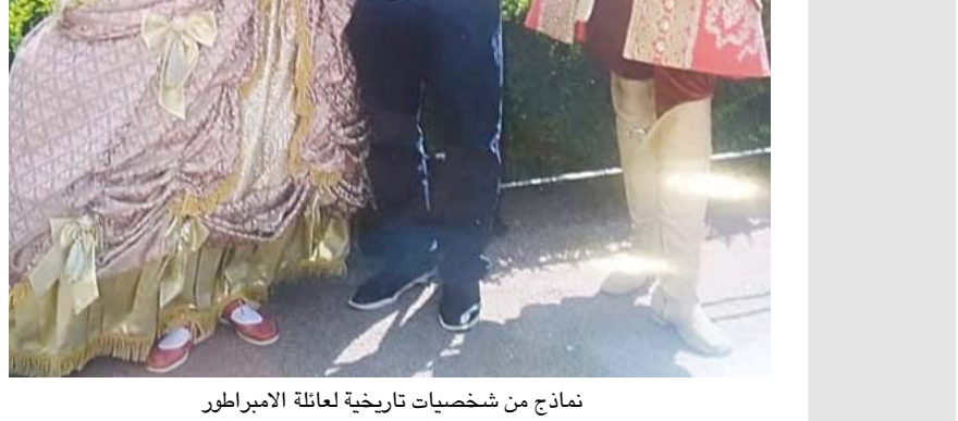
نماذج من شخصيات تاريخية لعائلة الامبراطور