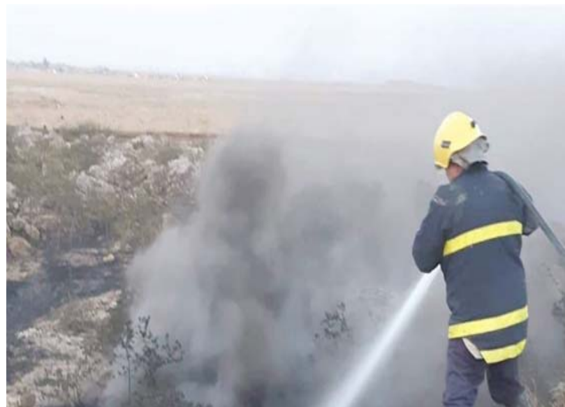
حرائق كبيرة في مناطق متفرقة من مدينة الموصل

خسائر حرائق الحنطة حاجز الغي دونما حتى الان. وقال رئيس اللجنة حفي السجوري لـ (الزمان) ان (خسائر حرائق الحنطة في ديالى تجاوزت حاجز الغي وبنه وبنه 80 بالمئة منها مفقعل). ثورة فلاحين و اشار الى ان (بعض الجهات تلتمح الى تورط فلاحين في حرق محاصيلهم لكسب تعويضات مالية لا دليل عليه وهو محض خيال لدى البعض). وكان عبد المهدي قد عد خلال مؤتمر الصحفي الاسبوعي، ان الحرائق التي تحدث في المحاصيل الزراعية حسالة طبيعية. وعد ناشطون الحرائق الازمة ومحاسبة المسؤولين عنها وتحويض الفلاحين وضمان عدم تكرار هذه الكوارث بالاوعام المقبلة). وفي ديالى اعلمت اللجنة الزراعية في مجلس محافظة ديالى تجاوز