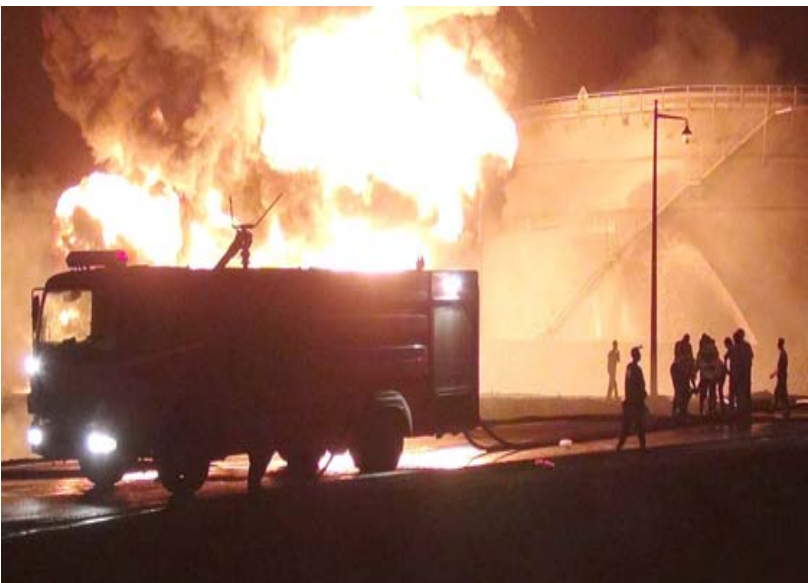
معمل كبريت المشراق