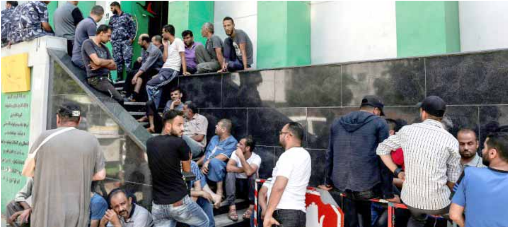
تسلم فلسطينيون ينتظرون تسلم المساعدة القطرية في غزة .

واندلعت في نيسان/ابريل الماضي مواجهة عسكرية هي الأضعف منذ حرب 2014 بين إسرائيل وفصائل فلسطينية في غزة استمرت ليومين . وقتل في هذه المواجهة 25 فلسطينياً بينهم تسعة عناصر فصائل مسلحة في حين قتل 4 في الجانب الإسرائيلي.