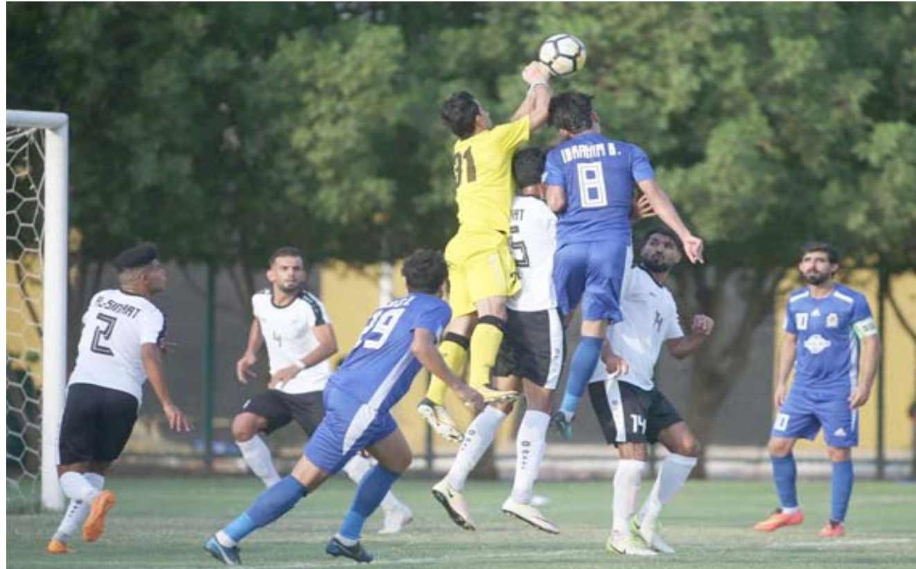
مواجهات: تواصل مباريات الدوري الممتاز رغم ارتفاع درجات الحرارة

ان يستفيد الديوانية من النقطة ليتقدم للموقع الخامس عشر كما استفاد المبناء من نقطته الغالية بالتعال مع الجوية ليتقدم للمركز السادس عشر في الوقت الذي حافظت فرق الشرطة والجوية والكرخ والزوراء وميسان والنفط والوسط والامانة والجنوب والبريل والطلبة والكهرباء والافواج التي افتقدت للتنظيم والقدرة على تقديم نفسها كما مطلوب منها في العودة لسباق النقاط بعد خسارة نصف نهائي الكأس قبل تلقي ضربة النقط التي زادت الطين ليله امام ادارة علاء كاظم ولن النتيجة سنتجعل الخلافات مع الجمهور الذي يندب حظه العاثر مرة اخرى، وشهدت الجولة 31 خمسة تغيرات عند مواقع النصف الثاني من سلم الترتيب عندما تراجع النجف جزءا في وقت تقدم الحدود بدلا منه في النسوة الذي تآثر الصناعات بخسارة الوسط ليرتاج للموقع السابع عشر قبل