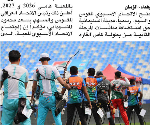
قوس: جانب من البطولات الدولية في لعبة القوس والسهم