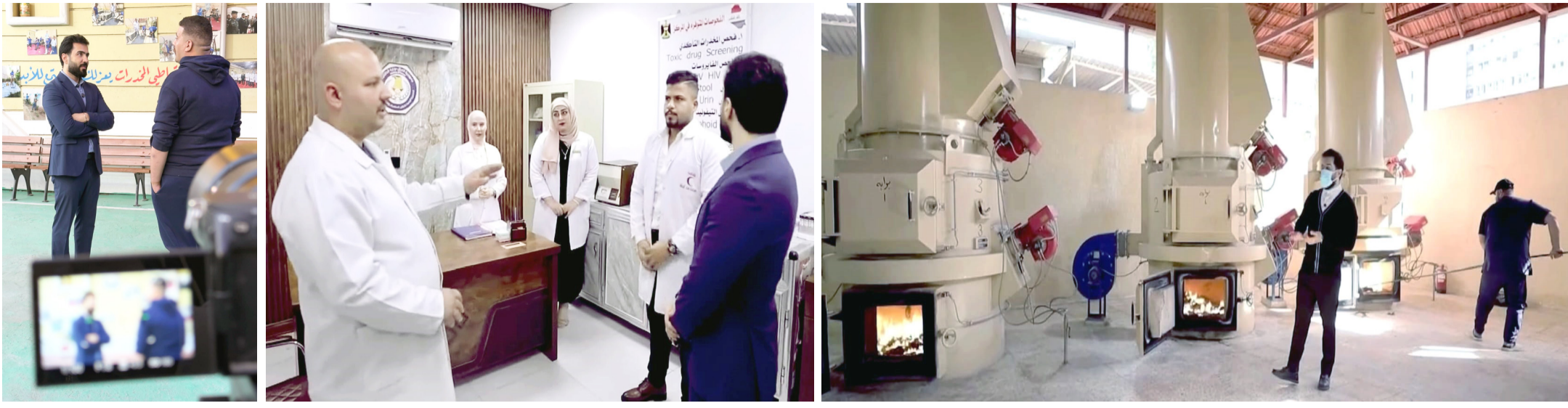
برنامج : لقطات من حلقة برنامج (كلام الناس) عن المخدرات